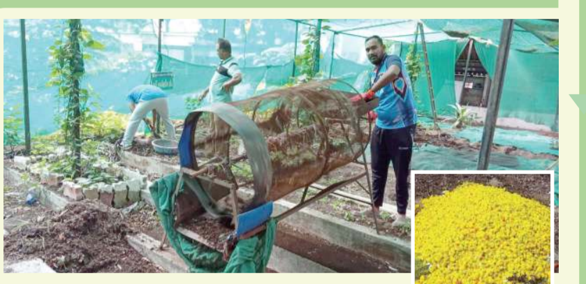
ફ્લાવર્સ વેસ્ટમાંથી ખાતર બનાવી શહેરના બાગ બગીચાઓને હરિયાળા કરાય છે

શહેરના મોટા મંદિરોમાંથી રોજ રોજ સુકાયેલા ફૂલ, પુષ્પમાળા એકત્રિત કરવામાં આવે છે. આ ફ્લાવર્સ વેસ્ટ કોર્પોરેશનના સેન્ટ્રલ અને કતારગામ ઝોન વિસ્તારમાં કાર્યરત કરવામાં આવેલા બે વર્મી કમ્પોસ્ટ પ્લાન્ટમાં લાવી તેમાંથી ખાતર બનાવાય છે. આ ખાતરથી કોર્પોરેશનના દરેક ઝોન એરિયામાં સ્થિત બાગ બગીચામાં ઝાડ છોડને પોષણ આપી બાગ બગીચાઓને હરિયાળા કરવા સાથે પર્યાવરણ સંરક્ષણની દિશામાં મહત્વપૂર્ણ પ્રદાન આપી રહી છે.