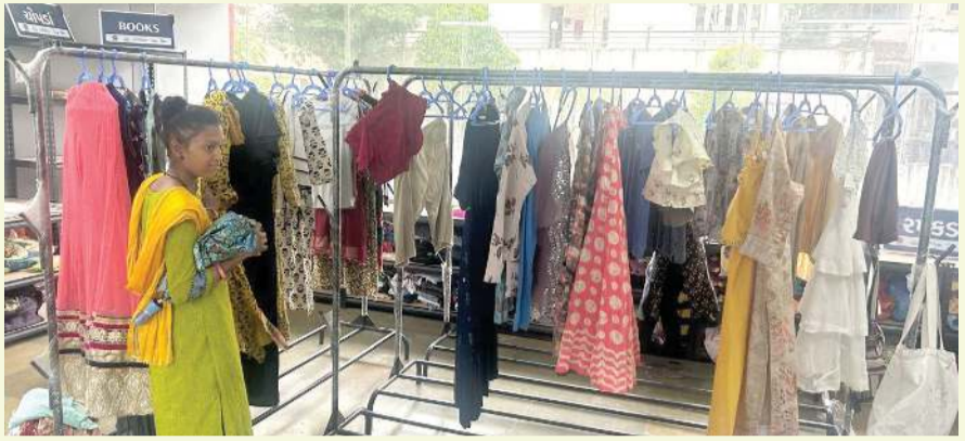
જેમને જરૂર નથી તે આપી જાય અને જેમને જરૂર છે તે લઈ જાયની SMCની અનોખી પહેલ