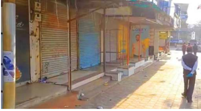
ધમરજન્તી વાહનોને કોઈ અડચણ ઊભી ન થઈ

વ્યારા: માંડળ ટોલ મુદ્દે સોનગઢ સજ્જડ બંધ રહ્યું હતું. સોનગઢના નાના-મોટા વેપારીઓ સાથે સ્ટોન ક્વોરીઓ તેમજ રેતી લીઝપરકોને ટોલનાકાની ભારે અસર જોવા મળી છે. ટોલનાકા પરથી અવરજવર કરવા આશરે ટ્રક દીઠ ૭૦૦થી ૧૦૦૦ જેટલી તગડી રકમ ચૂકવવી પડતી હોય સોનગઢનો ઔદ્યોગિક વ્યવસાય પડી ભાંગ્યો છે. જેથી મોટા ભાગની સ્ટોન ક્વોરીઓ ઠપ્પ થઈ ગઈ છે. અહીં સુધી કે બસમાં મુસાફરી કરતાં ગરીબ મુસાફરોને પણ પોતાની ટિકિટમાં આશરે રૂ.૧૦ જેટલી રકમ વધુ ચૂકવવી પડે છે. જિલ્લાનું મુખ્ય મથક વ્યારા હોવાથી રોજિંદી અવરજવર કરતાં ગ્રામિણ વિસ્તારના ગરીબ આદિવાસીઓ પીસાઈ રહ્યા છે. કારણકારણે પણ માસિક પાસ દીઠ ૨૦૦થી વધુ રકમ ચૂકવવી પડતી હોય સોનગઢમાંથી આ ટોલવ્યાજ