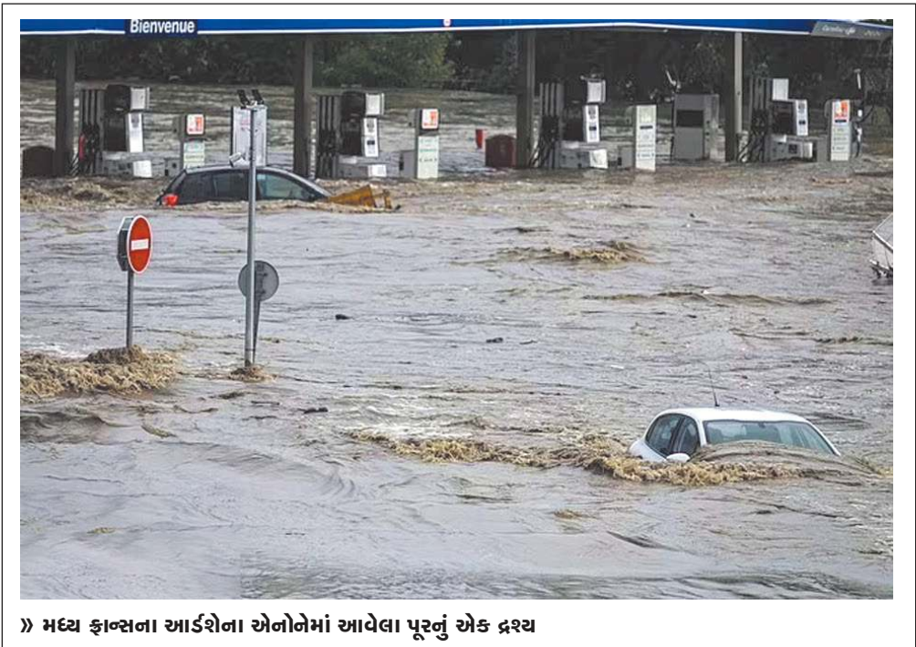
મધ્ય કાન્સના આરોગ્યના ઓળખાણને આવેલા પૂરનું એક દ્રશ્ય