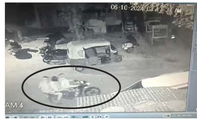
ગોત્રી વિસ્તારમાં રાત્રે ચોર બાહક સવાર ટોળકી સીસીટીવી કેમેરામાં કેદ

ધરની સુરક્ષા કરવા માટે આખી રાત સુધી ઉજાગરા કરવા મજબૂર બન્યા છે. લોકો પોતાના મોહલ્લા તથા સોસાયટીઓમાં આખી રાત સુધી રહેવાની કરી રહ્યા છે. ત્યારે ગઈકાલે મોડી રાત્રિના સમયે ફતેપુરા વિસ્તારમાં આવેલા મંગલેશ્વર ઝાપા પાસે તસ્કર ટોળકી એક સાથે ત્રાટકી આવી હતી. આ ટોળકીને લોકો જોઈ જતા બૂમભૂમ થઈ હતી જેમાં આ ટોળકી બાજુમાં આવેલ પાણીની પાટીમાંથી અંધારાનો લાભ લઈને ફરાર થઈ ગઈ હતી. બીજી તરફ ખોડીયાર નગર વિસ્તારમાં પણ તસ્કર ટોળકી ચોરી કરવાના ઈરાદે આવી હતી. પરંતુ લોકો જાગી જતા અંધારામાં ગાયબ થઈ ગઈ હતી. હથિયારો સાથે આવેલા ચોરોના કારણે વિસ્તારમાં રહેતી મહિલાઓ સહિત લોકોમાં ડર ફેલાયો છે અને પોલીસ દ્વારા નાઈટ પેટ્રોલિંગ સહન બનાવવામાં આવે તેવી પણ માંગ કરવામાં આવી રહી છે.