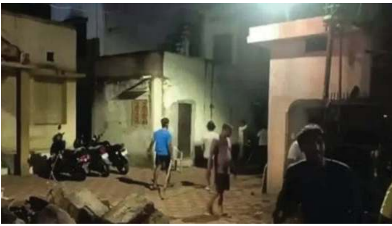
શહેરમાં તસ્કરોની દહેશત : નવરાત્રિના ઉજાગરા બાદ હવે પોલીસના ચોરોને પકડવા જાગરણ