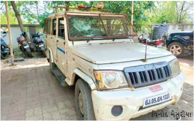
આ આરોપીને ડિટેઇન કરાયા