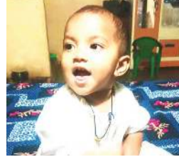
તપાસ કરી રોગચાળો કેવી રીતે વકર્યો તે જાણવાની પણ તરદી ન લેતા એક પછી એક લોકો મોતના ખપ્પરમાં હોમાવા લાગ્યા છે.

નેત્રંગમાં ઝાડા-ઊલટીના વાવરમાં એક માસૂમ દીકરી હોમાઈ ગઈ: ખાનગી દવાખાને લઈ ગયા તો ડોક્ટરનો સૂતા હતા, પછી આવવા કહ્યું