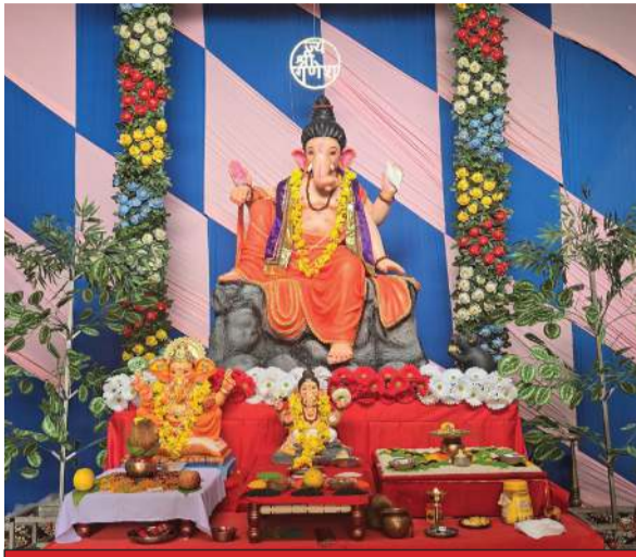
મહાકાલ યુવક મંડળ - નસવાડી