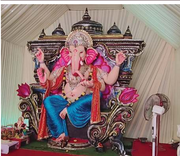
છીપવાડનાકા યુવક મંડળ - પાદરા