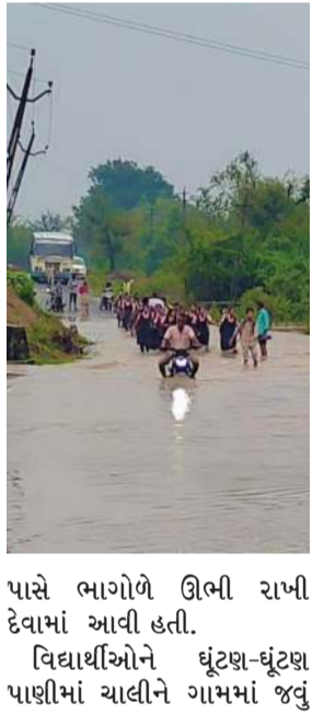
પાસે ભાગોળે ઊભી રાખી દેવામાં આવી હતી. વિદ્યાર્થીઓને ઘૂંટણ-ઘૂંટણ પાણીમાં ચાલીને ગામમાં જવું

(પ્રતિનિધિ) સંખેડા તા.11 એ સમયે સંખેડાથી સ્કૂલના વિદ્યાર્થીઓને લઈ અને સંખેડાથી મોરખલા તરફ જતી એસટી બસ કાવીઠા ગામની ભાગોળે તળાવ નજીક કોતરના પાણી આવી જતા બસ રસ્તામાં જ ઉભી રહી ગઈ હતી. જેથી વિદ્યાર્થીઓને બસમાંથી ઉતરી ઘૂંટણ ઘૂંટણ પાણીમાં ઉતરીને ગામમાં જવાબ મજબૂર બન્યા હતા. સંખેડા તાલુકામાં બપોરે સાંભેલા ધાર વરસાદ વરસ્યો હતો. જેથી કાવિઠા ગામની ભાગોળે રસ્તા ઉપર પાણી ભરાયા હતા. એ સમયે સંખેડા થી મુરખલા બસ વિદ્યાર્થીઓને લઈને આવતી હતી પરંતુ કાવીઠા ગામની ભાગોળે વરસાદી પાણી ભરાઈ જવાથી બસ ને તળાવ