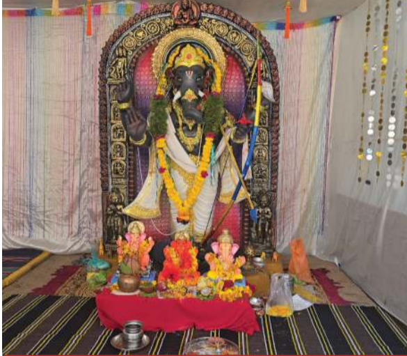
માણેકચોક યુવક મંડળ - નસવાડી