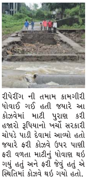
રીપેરીંગ ની તમામ કામગીરી ધોવાઈ ગઈ હતી જ્યારે આ કોઝવેમાં માટી પુરાણ કરી હજારો રૂપિયાનો ખર્ચો સરકારી ચોપડે પાડી દેવામાં આવ્યો હતો જ્યારે ફરી કોઝવે ઉપર પાણી ફરી વળતા માટીનું ધોવાણ થઈ ગયું હતું અને ફરી જેવું હતું એ સ્થિતિમાં કોઝવે થઈ ગયો હતો.

(પ્રતિનિધિ) નસવાડી તા.11 નસવાડી તાલુકાના રાજપુરા ગામનો લો લેવલનો કોઝવે રીપેરીંગ બાદ ફરી ધોવાઈ જતા બે દિવસ થી પ્રાથમિક શાળા બંધ છોટાઉદેપુર જિલ્લાના નસવાડી તાલુકાના રાજપુરા ગામ પાસે થી અશ્વિન નદી પસાર થાય છે તેના ઉપર પંચાયત માર્ગ મકાન વિભાગ ની માલિકી નો વર્ષો પુરાણો કોઝવે આવેલો છે અગાઉ વરસાદ પડ્યો હતો ત્યારે પાંચ દિવસ સુધી ગામ સંપર્ક વિહીણ રહ્યું હતું જ્યારે પંચાયત માર્ગ મકાન વિભાગે આ કોઝ વે તુટતાં લાખો રૂપિયાનો ખર્ચ કરી રીપેરીંગ કરાવ્યું હતું પરંતુ ફરી વરસાદ પડતા કોઝવે ના