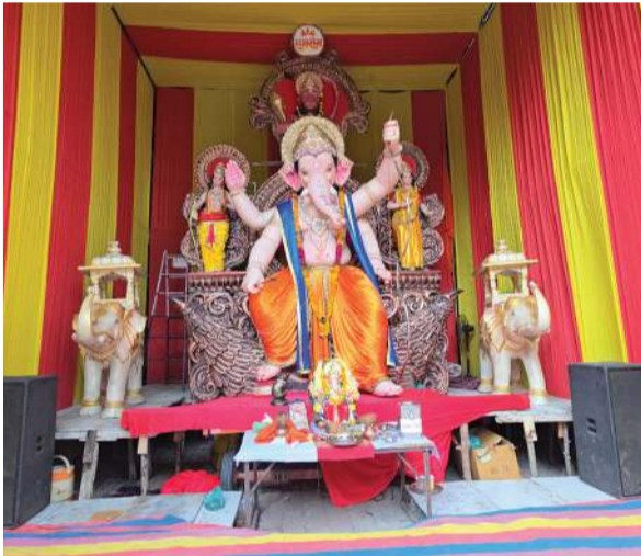
રામસેના યુવક મંડળ - નસવાડી