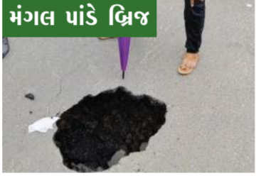
મંગલ પાંડે બ્રિજ