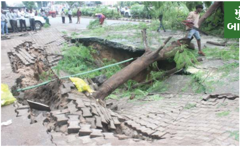
મુંજમહુડાનો રોડ એક બાજુથી બંધ કરી દેવાયો

વડોદરા શહેરના નાગરિકો પેટે પાટા બાંધીને સમયસર પોતાનો વેરો વડોદરા મહાનગરપાલિકા ભરપાઈ કરે છે. અને તેઓ એક જ આશા તંત્ર પાસે રાખે છે કે તેમના દ્વારા ભરપાઈ કરવામાં આવેલ વેરાથી તેમને પ્રાથમિક સુવિધાઓ મળી રહેશે અને વડોદરાનો વિકાસ થશે. પરંતુ મહાનગરપાલિકા ના પ્રશ્ન અધિકારીઓ અને સત્તાના નશામાં ચોર સત્તાપીશોના પાપે વડોદરા શહેરના નાગરિકો દ્વારા ભરપાઈ કરવામાં આવેલ વેરો ફક્ત ભૂવાઓ નું સમારકામ કરવામાં વેડફાતો હોય તેવું જણાઈ આવે છે.