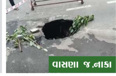
વાસણા જ નાંકા