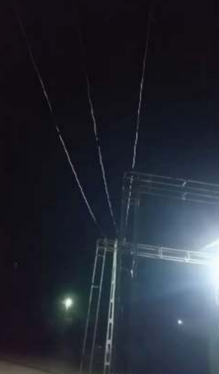
પંડાલને અડી ગયેલો વીજ વાયર

(પ્રતિનિધિ) પાદરા/વડોદરા તા.4 હાલ રાજ્યમાં વરસાદી માહોલ આવી રહ્યો છે, તો બીજી તરફ આગામી શનિવારથી ગણેશ ચતુર્થીનો તહેવાર શરૂ થઈ રહ્યો છે. જેને લઈને તમામ તૈયારીઓ શરૂ થઈ ગઈ છે. ત્યારે પાદરાના ડબકા ગામે એક આપાતજનક ઘટના સર્જાઈ છે. જેમાં ગણેશ પંડાલ બાંધી રહેલા 16 એકસાથે યુવકોને કરંટ લાગ્યો હતો. જેમાં એક યુવકનું ઘટનાસ્થળે જ મોત નિપજતાં વાતાવરણ ગામગીન બની ગયું હતું.