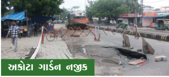
અકોટા ગાર્ડન નજીક

100 મીટર ના અંતરે ત્રણ મહાકાય ભૂવાઓને લીધે અકોટા મુંજમહુડા રોડ પર ભારે ટ્રાફિકજામના દ્રશ્યો સર્જાયા હતા. ભૂવાઓ પડવાના કારણે એક તરફનો રોડ વાહન વ્યવહાર માટે બંધ કરી દેવામાં આવ્યો હતો અને ભૂવાઓનો વહેલી તકે નિકાલ ન આવતા તેના લીધે ત્યાંથી અવરજવર કરતા દરેક વાહન ચાલકોને મુશ્કેલીમાં મુકાયા હતા.