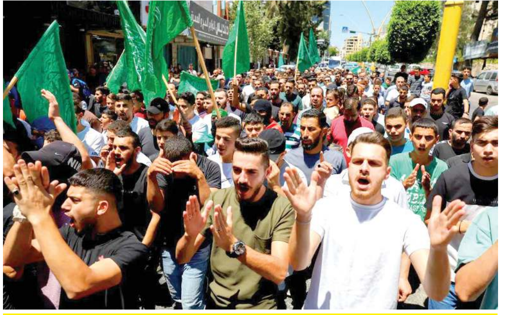
હુમાસના વડા ઈસ્માઇલ હનીયેહની હત્યાના વિરોધમાં સેંકડો લોકોએ કબજા હેઠળના વેસ્ટ બેંક તેમજ લેબનોન અને ઈરાનમાં કૂચ કરી છે.

હનીયેહના મૃત્યુ અંગે વ્હાઈટ હાઉસ તરફથી તાત્કાલિક કોઈ પ્રતિક્રિયા આવી ન હતી. મુખ્ય પ્રશ્ન એ હતો કે શું ઈરાયેલે તેના ટોચના સાથી અમેરિકાને સમય પહેલા જણાવ્યું હતું. હનીયેહની હત્યા વિશે પૂછવામાં આવતા, અમેરિકા સ્ટેટ સેક્રેટરી એન્ટોની બ્લિન્કને કહ્યું, 'આ એવી બાબત છે જે અમે જાણતા ન હતા અથવા તેમાં સામેલ ન હતા.' ચીને હુમલાને વખોડ્યો છે.