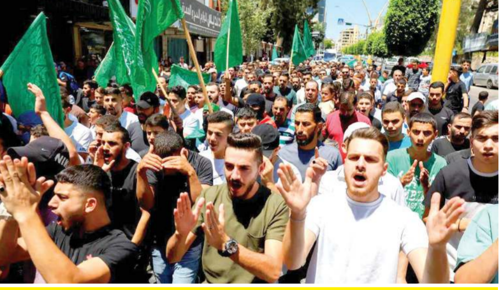
હુમાસના વડા ઈસ્માઈલ હનીયેહની હત્યાના વિરોધમાં સેંકડો લોકોએ કબજા હેઠળના વેસ્ટ બેંક તેમજ લેબનોન અને ઈરાનમાં ફૂંચ કરી છે.

જેરૂસલેમ, તા. ૩૧ (એપી): બેરુત અને તેહરાનમાં ત્રાસવાદી નેતાઓ પર ઈઝરાયેલના હુમલાઓએ ક્ષેત્રમાં તણાવ વધાર્યો છે, સાથે જ ઈઝરાયેલ દ્વારા નિશાન બનાવીને કરાયેલી હત્યાઓની યાદીમાં ઉમેરો કર્યો છે. અહીં અમુક હુમલાઓ છે જેમાં ઈઝરાયેલે નિશાન બનાવીને હત્યા કરી હતી: જુલાઈ 2024: ગીચ દક્ષિણી ગાઝા પટ્ટીમાં મોટો હુમલો કરી ઈઝરાયેલે હુમાસના સંદિગ્ધ સૈન્ય કમાન્ડર મોહમ્મદ દીકની હત્યા કરી હતી, આ હુમલામાં બાળકો સહિત 90 લોકો માર્યા ગયા હતા. એપ્રિલ 2024: સીરિયામાં ઈરાનના દૂતાવાસ પર થયેલા હુમલામાં ઈરાનના બે જનરલનાં મૃત્યુ થયાં હતા, ઈરાને કહ્યું હતું આ હુમલો ઈઝરાયેલે કર્યો હતો. જાન્યુઆરી 2024: બેરુતમાં ઈઝરાયેલના એક ડ્રોને હુમલો કર્યો હતો જેમાં હુમાસના ટોચના