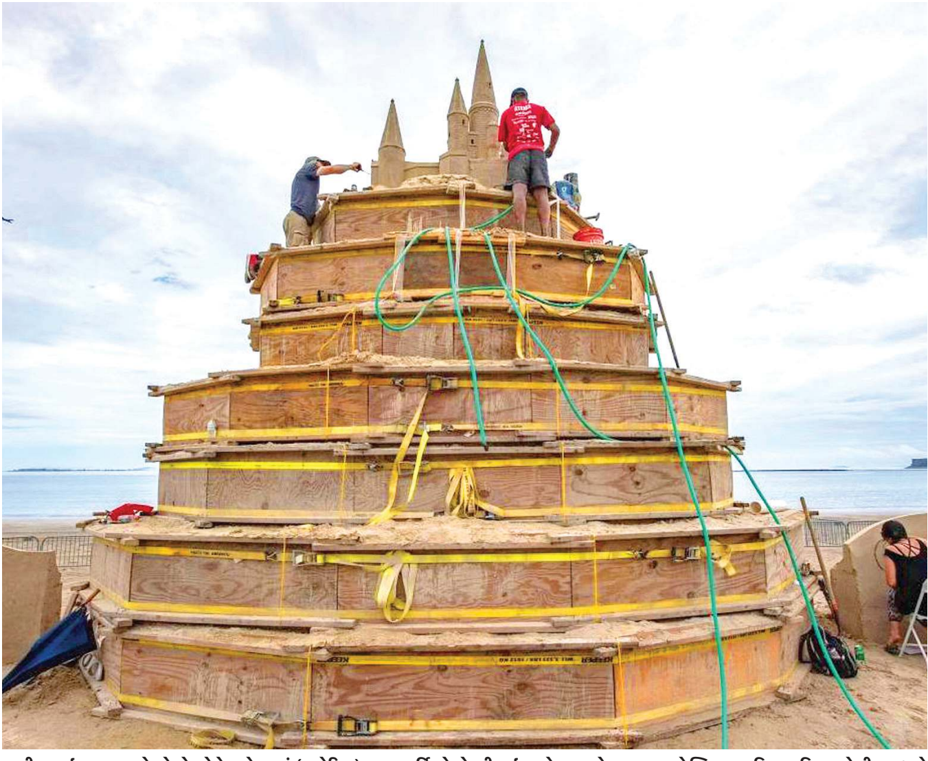
13મી જુલાઈ, 2024ના રોજ રેવેરેન્ડ, મેસેચ્યુસેટ્સમાં (અમેરિકા) 20મા વાર્ષિક રેવેરેન્ડ ઈન્ટરનેશનલ સેન્ડ સ્કલ્ચર ફેસ્ટિવલ દરમિયાન વિશાળ રેલીના સ્થાને શિલ્પકારો કલાકૃતિ બનાવતા નજરે પડે છે. આ ઉજવણી 19 જુલાઈના રોજ ખુલશે અને 21 જુલાઈ સુધી ચાલશે.

ડોલરમાં ટી-શર્ટ ઉપલબ્ધ છે. સપ્તાહના અંતે ચાઇનીઝ રિટેલરોએ શનિવારના રોજ એક રેલીમાં ટ્રમ્પ પર હત્યાનો પ્રયાસ કર્યા પછી દેશના બે સૌથી મોટા ઇ-કોમર્સ પ્લેટફોર્મ તાઓબાઓ અને જેડીડોટકોમે તસવીરોથી કમાણી કરી લેવાની ટેવારી કરી દીધી હતી. ઓનલાઇન કરતા સ્ક્રીનશોટ અનુસાર, એક ટી-શર્ટ પર લખ્યું હતું, “અમેરિકાને ફરીથી મહાન બનાવો” અન્ય એક ટી-શર્ટ પર લખ્યું હતું, “ગોળીબાર મને વધુ મજબૂત બનાવે છે.” શર્ટ પર એ ક્ષણને કેદ કરનાર ઘણા પ્રકારની તસવીરોનો ઉપયોગ કરવામાં આવ્યો છે. જેમાં એસોસિએટેડ પ્રેસ ફોટોગ્રાફર ઈવાન વુચી દ્વારા લેવામાં આવેલી સૌથી અવિશ્વસનીય તસવીર પણ સામેલ છે.