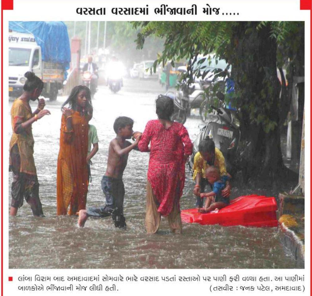
વાંબા વિસ્તાર બાદ અમદાવાદમાં સોમવારે ભારે વરસાદ પડતાં રસ્તાઓ પર પાણી ફરી વળ્યા હતા. આ પાણીમાં બાળકોએ ભીંજાવાની મોજ લીધી હતી.