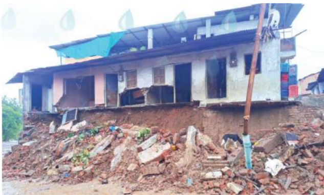
માંડવી-તરસાડાને જોડતો રૂ.૪૭ કરોડના ખર્ચે બનેલા નવા પુલની સાઈડ વોલનું ધોવાણ

બારડોલી: બારડોલીના શાકભાજી માર્કેટથી મીંઢોળા ઓવરા જતાં માર્ગ પર આવેલા ચાર મકાનોની આગળની દીવાલ તૂટી પડતાં ઘરમાં સૂતેલા પશુચરણનો ચોંકો ઊઠ્યા હતા. આ ઘટનામાં એક યુવકને ઘણા ઘર્ષ હોવાનું જાણવા મળ્યું છે. દીવાલ નીચે બે મોટરસાઇકલ દબાઈ જવાથી નુકસાન થયું હતું.