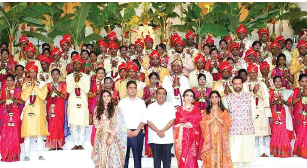
કરવામાં આવ્યું હતું. મીડિયા સાથેની વાતચીતમાં તેણે કહ્યું હતું કે, તે તેને લગ્નનું આમંત્રણ આપવા મંદિરે આવ્યો હતો. અનંત અંબાણી મંદિરમાં આયોજિત પૂજા અને હવનનો એક ભાગ હતા.

મુંબઈ, તા. ૨: ભારતીય બિગ બેસ ટાયટલ મુકેશ અંબાણીના પુત્ર અનંત અંબાણી ટ્રસ્ટ સમયમાં રાધિકા મરંચ્ટ સાથે લગ્ન કરવા જઈ રહ્યા છે. લગ્નની તમામ તૈયારીઓ લગભગ પૂર્ણ થઈ ગઈ છે, જેના માટે સોના-ચાંદીથી બનેલા લગ્નના કાર્ડનું વિતરણ પણ શરૂ થઈ ગયું છે. અનંત-રાધિકાના લગ્ન પહેલા અંબાણી પરિવારે ગરીબોના સમૂહ લગ્નનું આયોજન કર્યું છે, જેમાં તેમણે પોતાના ખર્ચે મોટા પાયે 50 ગરીબ યુગલોના લગ્ન કરાવ્યા હતા. મુકેશ અંબાણીની પુત્રી ઈશા અંબાણીએ પણ પતિ આનંદ પીરામલ સાથે સમૂહ લગ્નમાં હાજરી આપી હતી. તેણે નવપરિણીત યુગલોને ભેટ આપી હતી. હાલમાં જ અનંત અંબાણી નેવરલના કુચ્છા કાલી મંદિર પહોંચ્યા હતા. મંદિરમાં તેમનું ભવ્ય સ્વાગત