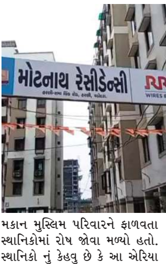
પૈકી ૪૬૧ મકાનના સ્થાનિકો એ એકલા થઈ પાલિકા વિરૂદ્ધ સુનોચાર કરી વિરોધ પ્રદર્શન કર્યું હતું.