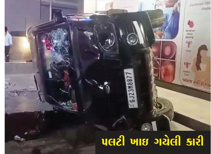
પલટી ખાઈ ગયેલી કારી