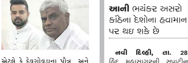
એટલે કે દેવગોવડાના પૌત્ર અને વર્તમાન સાંસદ પ્રજ્વલ રેવન્ના સામે જાતીય સતામણીના તથા પીછો કરવાના કેસ નોંધવામાં આવ્યા છે. હાસન જિલ્લાના હોલેનરસીપુર પોલીસ મથકમાં કેસ નોંધવામાં ... અનુસંધાન પાના 2 પર >

દરની રસોઇચાની ફરિયાદના આધારે કેસ દાખલ, પિતા ટેવળા માજી મંત્રી અને દીકરો પ્રજ્વલ વર્તમાન સાંસદ છે