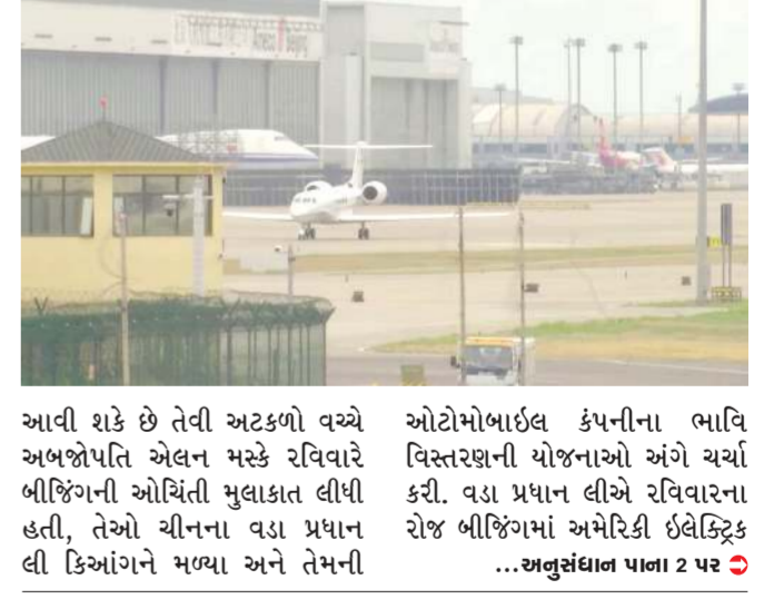
આવી શકે છે તેવી અટકળો વચ્ચે અભજોપતિ એલન મસ્કે રવિવારે બીજિંગની ઓચિંતા મુલાકાત લીધી હતી, તેઓ ચીનના વડા પ્રધાન લી કિઆંગને મળ્યા અને તેમની ઓટોમોબાઇલ કંપનીના ભાવિ વિસ્તરણની યોજનાઓ અંગે ચર્ચા કરી. વડા પ્રધાન લીએ રવિવારના રોજ બીજિંગમાં અમેરિકી ઈલેક્ટ્રિક લી કિઆંગને મળ્યા અને તેમની ... અનુસંધાન પાના 2 પર >

મસ્કે વડાપ્રધાન લી કિઆંગ સાથે મુલાકાત કરી