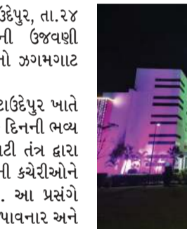
વહીવટી તંત્ર દ્વારા કરવામાં આવ્યું છે. આ ઉપરાંત જિલ્લામાં સર્વશ્રેષ્ઠ કામગીરી કરનાર કર્મચોરોઓ તેમજ સિદ્ધિવંતોને પ્રમાણપત્રો આપીને નવાજવામાં આવશે. સાથે સાથે છોટાઉદેપુર જિલ્લાના 6 તાલુકાઓમાં પણ સરકારી ઈમારતો ને રોશનીથી સજાવી દેવામાં આવી છે. અને સાથે સાથે ઠેર ઠેર જગ્યાએ શાળાઓમાં સાંસ્કૃતિક કાર્યક્રમો, દેશ ભક્તિના ગીતો, વગેરે નું આયોજન કરવામાં આવશે સમગ્ર જિલ્લામાં રાષ્ટ્રીય પર્વને ઉજવવા નાગરિકોને ભારે ઉત્સાહ જોવા મળી રહ્યો છે.

(પ્રતિનિધી) છોટાઉદેપુર, તા.૨૪ છોટાઉદેપુરમાં પ્રજાસત્તાક દિનની ઉજવણી અર્થે સરકારી ઈમારતો ઉપર રોશનીનો ઝગમગાટ જોવા મળ્યો. છોટાઉદેપુર જિલ્લાના વડામથક છોટાઉદેપુર ખાતે આવનાર 26 મી જાન્યુઆરી પ્રજાસત્તાક દિનની ભવ્ય અને દબદબાભેર ઉજવણી અર્થે વહીવટી તંત્ર દ્વારા જિલ્લા સેવા સદન કચેરી તથા જિલ્લાની કચેરીઓને રોશનીથી સજાવી દેવામાં આવી છે. આ પ્રસંગે અંગ્રેજોના રાજમાંથી દેશને આઝાદી અપાવનાર અને દેશ માટે બલિદાન આપનાર વીર શહીદોને યાદ કરી શ્રદ્ધાંજલિ આપવામાં આવશે. અને ગર્વ સાથે રાષ્ટ્રધ્વજ ફરકાવી રાષ્ટ્રધ્વજ ને સલામી આપવામાં આવશે. જિલ્લા કલેક્ટર દ્વારા જિલ્લાના બોડેલી ખાતે રાષ્ટ્રધ્વજ ફરકાવવામાં આવશે. જેના આગોતરા આયોજન અર્થે તૈયારીઓ આરંભી દેવામાં આવી છે. નગરમાં આવેલી સરકારી ઈમારતો ઉપર રોશની કરી દેવામાં આવી છે. જે નજારો ભવ્ય લાગી રહ્યો છે. છોટાઉદેપુર જિલ્લાના બોડેલી ખાતે યોજાનારા જિલ્લા કક્ષાના પ્રજાસત્તાક પર્વની ઉજવણી દરમિયાન રંગારંગ સાંસ્કૃતિક કાર્યક્રમોનું આયોજન પણ જિલ્લા