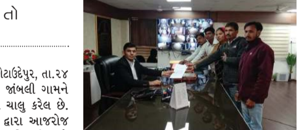
આ બાબતે તાલુકા વિકાસ અધિકારી, તલાટી તેમજ મહિલા સરપંચના પુત્રને ટેલિફોનિક અને મૌખિક રજૂઆત કરવા છતાં અમારી કોઈ રજૂઆત ગ્રાહ્ય રાખ્યા વગર પોતાની મનમાની મુજબ કામ ચાલુ રાખેલ છે. જે સરકારી યોજાનાનો દૂર ઉપયોગ કરતા સ્પષ્ટ દેખાય છે. આ અમારી રજૂઆત બાબતે ગંભીર નોંધ લેવામાં આવે અને ગ્રામજનોની માંગ મુજબ સંતોષકારક નિર્ણય 7 દિવસમાં લેવામાં આવે જો અમારી માંગ સ્વીકારવામાં નહિ આવે તો અમો ગ્રામજનો આંદોલન કરીશું અને તાત્કાલિક કામ અટકાવીશું તેમ આપેલ લેખિત રજૂઆત પત્રમાં જણાવ્યું છે.

નહીં સ્વીકારવામાં આવે તો આંદોલનની ચિંમકી