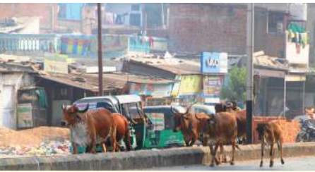
સેવાસી કેનાલ પાસે ઢોરવાડા એ રોડ બ્લોક કર્યો

(પ્રતિનિધી) વડોદરા, તા.24 વડોદરામાં રખડતા ઢોર ને પકડવાની કામગીરીમાં હવે સિસિટીવી કેમેરા મહત્વનો ભાગ ભજવશે પરંતુ જ્યાં કેમેરા જ નથી તેવા નવાયાં સહિત ના વિસ્તારો માં રખડતી ગાયો જોવા મળી છે. શહેર ના છેવાડે આવેલા વિવિધ વિસ્તારો મા પુલ્લે આમ રખડતા ઢોર અને ગેરકાયદે ચાલતા ઢોરવાડા પર હજુ સુધી કોઈ કાર્યવાહી કરવામાં આવી નથી. માત્ર મુખ્યમંત્રી ના આદેશ ને અનુસરવા થોડી માત્રા મા પશુ ને પકડવામાં આવે છે. ગણતરી ના જ ઢોરવાડા તોડવા છે. જ્યારે અન્ય અડીખમ ઉભા છે. આવા ગેરકાયદેસર ધમધમતા ઢોરવાડા પર કોની રહેમ નજર છે? તેવા આશ્લેષો નગરજનોએ કર્યા છે રખડતા પશુઓ સામે કાર્યવાહી માટે પાલિકાએ ટેકનોલોજીનો સહારો લીધો છે. કમ્પ્યુટર એન્ડ ડ્રોન સેન્ટર પાલિકાના 29 સ્પોટ અને જંકશનો પર રખડતા ઢોરના ફોટો કેપ્ચર કરી ઢોર માલિકને શોધી કાર્યવાહી થઈ રહી છે. સોમવારે પાલિકાને આવા 41 ફોટો મળ્યા હતાં. અત્યાર સુધીમાં પાલિકાએ 343 પશુ પકડી તેને પાંજરે પૂર્યાં છે. 66 ગેરકાયદે પશુવાડાને નોટિસ આપી 18ને તોડી પાડ્યા છે. જ્યારે ડેંગિંગના આધારે 16 પશુપાલકો વિરુદ્ધ ફરિયાદ નોંધાવી છે. નોંધવનિય છે કે, સોમવારે 41 ફોટોગ્રાફને આધારે ઢોર પાર્ટીના અધિકારીઓને મોકલી 39 પશુઓને ઝડપી લેવાયા હતા.