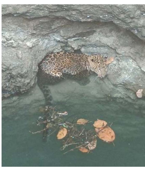
કાલોલ તાલુકાના નાદરખા ગામમાં એક ખેડૂતના ખેતર નાકુવામાં દીપડો પડી જતા વન વિભાગ દ્વારા સલામત રીતે રેસ્ક્યૂ ઓપરેશન કરી બહાર કાઢવામાં આવ્યો નાદરખા ગામમાં એક ખેડૂત પોતાના ખેતરમાં ખેતીના કામમાં વ્યસ્ત હતા ત્યારે કૂવામાંથી કોઈ પ્રાણીનો અવાજ સંભળાવો ખેડૂતે કૂવામાં વળેને ખેડૂં તો એક દીપડો કૂવામાં પડી ગયો હતો ખેડૂતે તાત્કાલિક વેવલપુર વન વિભાગને જાણ કરી હતી વેવલપુર વન વિભાગ દ્વારા દીપડાને સલામત રીતે બહાર કાઢી પાંજરામાં પુરી વંતગામમાં છોડી દેવામાં આવ્યો હતો આમ વન વિભાગ દ્વારા દીપડાને પકડી પાડવાથી નાદરખા ગામના લોકોએ રાહતનો શ્વાસ લીધો હતો.