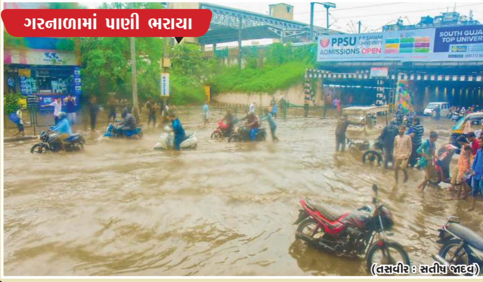
ગરનાળામાં પાણી ભરાયા