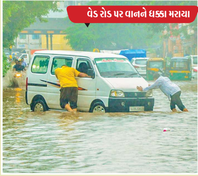
વેડ રોડ પર વાનને ઘસી મરાયા

For live updates : Like /Gujaratmitra | Follow /Gujaratmitra | /Gujaratmitr | Subscribe /Gujaratmitra | /Gujaratmitra | www.gujaratmitra.in