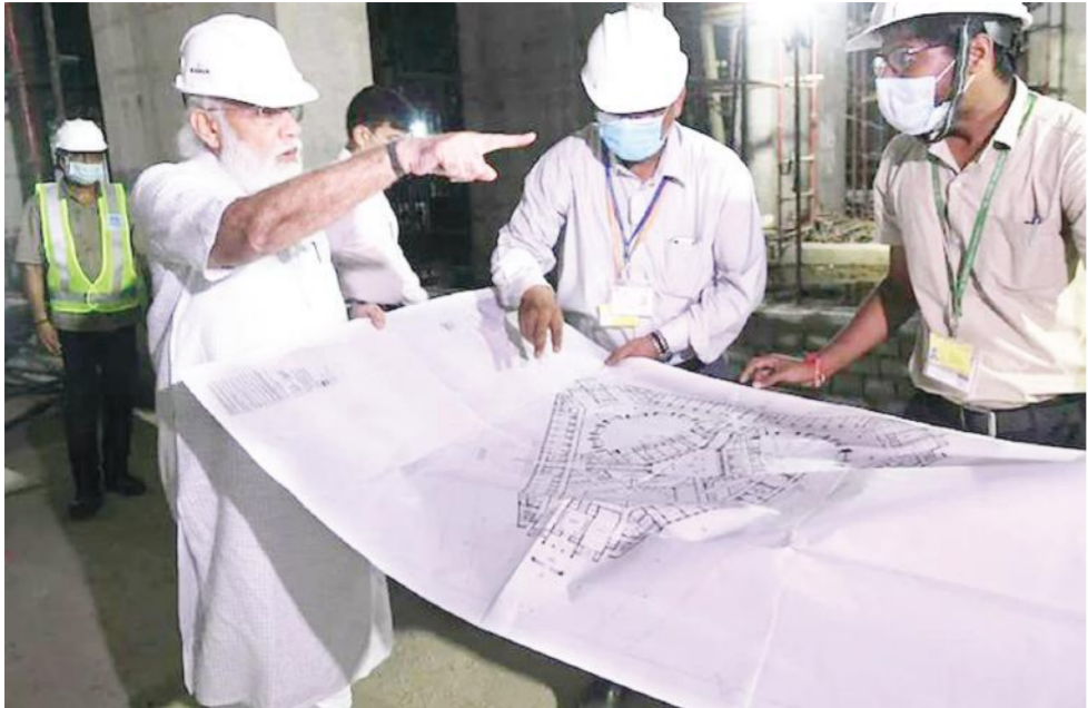
અમેરિકાથી નિર્ધારિત કાર્યક્રમ કરતા એક દિવસ વહેલા સંસદને પરત આવી ગયેલા વડાપ્રધાન મોદીએ નરેન્દ્ર મોદીએ રવિવારે સેન્ટ્રલ વિસ્તા પ્રોજેક્ટના સ્થળની મુલાકાત લીધી હતી. આ પ્રોજેક્ટ હેઠળ નવું સંસદ ભવન બંધાઈ રહ્યું છે. મોદીએ આ બંધકામ સ્થળની મુલાકાત લઈને ઇજનેરો સાથે વાતચીત કરી હતી. આ સેન્ટ્રલ વિસ્તા પ્રોજેક્ટ ઘણો વિવાદસ્પદ બન્યો છે અને અદાલતમાં પણ ગયો છે.