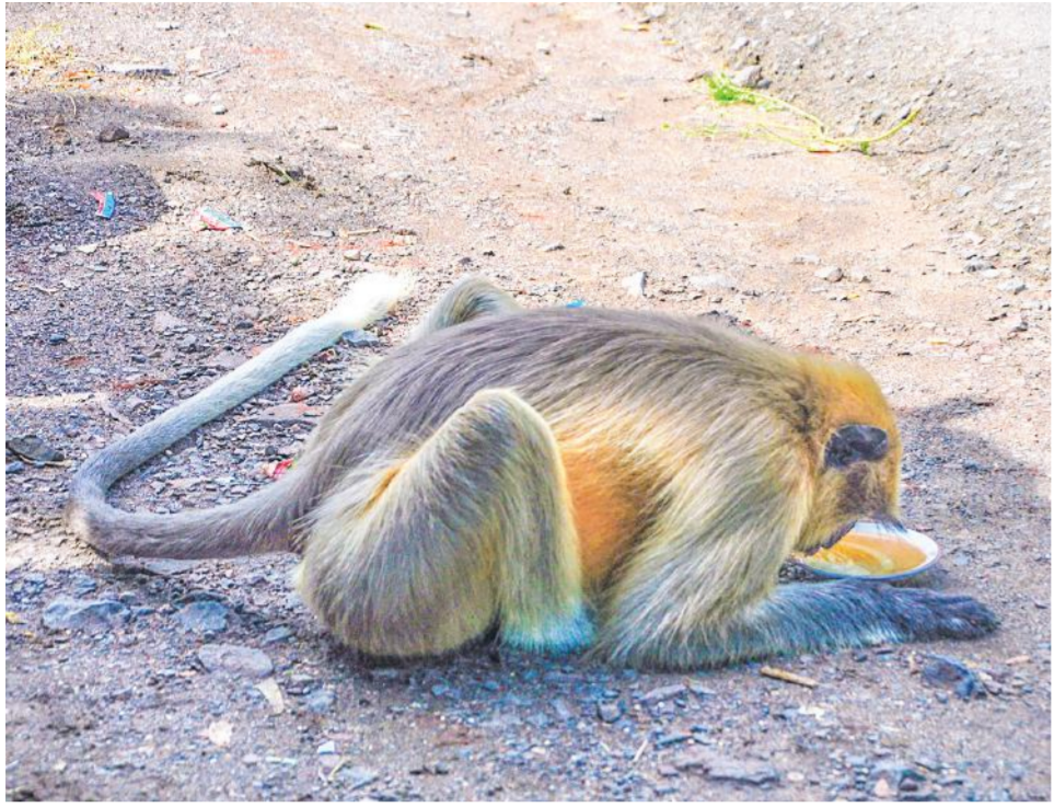
સામાન્ય રીતે માણસો સવારે ઉઠીને ચા પીવાની ટેવ ધરાવતા હોય છે. વિદેશમાં લોકો ફક્ત મગમાં ચા કે કોફી પીતા હોય છે. રક્ષાબંધનના પર્વના દિવસે માત્ર ભારતમાં જ છે. જો કે, સુરતના કુમરમાં એક વાનર એવો છે કે જેને સવારે ચા પીવા વગર ચાલતું નથી. અહીં તે ચાની રાહ ખેંચને બે થી ત્રણ કલાક બેસી રહે છે અને ચા વાળો તેને રક્ષાબંધન માં ચાખે એટલે તે પીને તરત સ્વાના થઈ જાય છે.