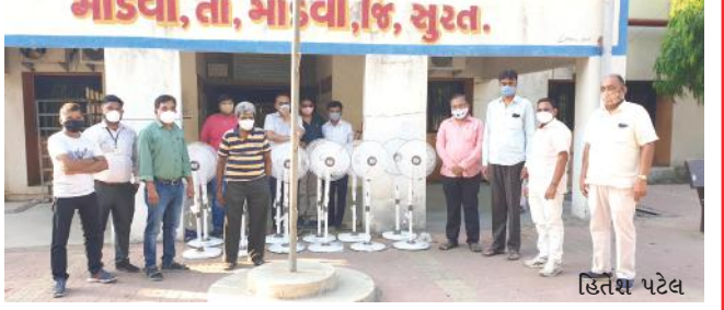
માંડવી: માંડવી રેફરલ હોસ્પિટલ ખાતે કોવિડ-19 સેન્ટરમાં સેતુ, સંવેદના રોસ્ટરેબલ ટ્રટર તરફથી સાંસદ પ્રભુ વસાવાના હસ્તે 12 ઊંચા પંખાનું વિતરણ કરાયું હતું. જેથી કોરોનાના દર્દીઓને રાહત મળશે.

માંડવી રેફરલ હોસ્પિટલ ખાતે પંખાનું વિતરણ કરાયું