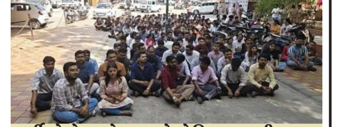
દર્દીઓએ અને સગાએ પેનિક થવાની જરૂર નથી : ગોત્રી હોસ્પિટલના આરએમઓ

ઓપીડી, વોર્ડ ફરબો અને બિન-દમરજવ્સી સર્જરી સહિતની તમામ બિન-દમરજવ્સી ફરબો ગંદ રાખી વિરોધ