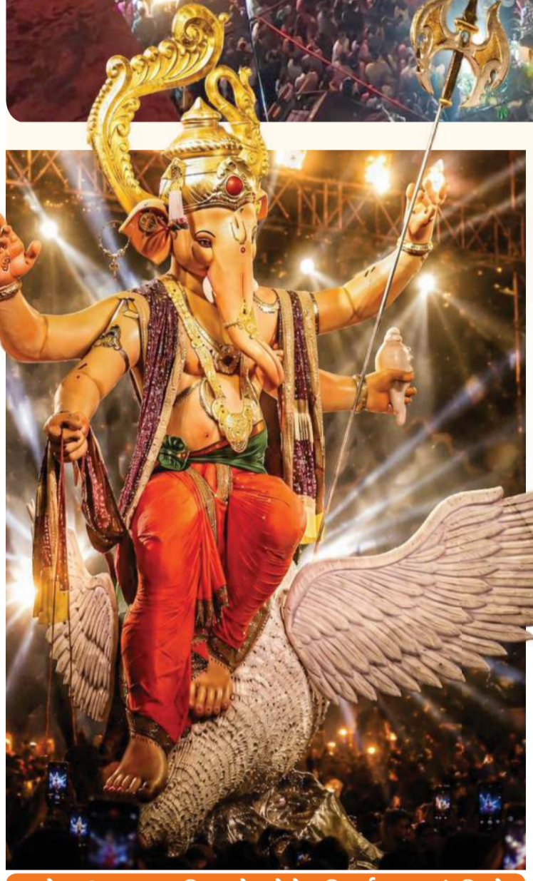
ગણેશ ઉત્સવ 11 દિવસનો રહેશે, વિસર્જન 12માં દિવસે