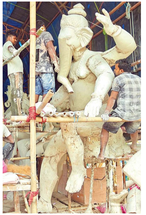
મુંબઈના મોટા મૂર્તિકારો સુરતમાં મૂર્તિ બનાવવા આવી રુક્યા છે

હવે ગણપતિ ઉત્સવમાં બે નવા ટ્રેન્ડ ઉભરાયા છે. પાટ પૂજન અને લોરી પૂજન પણ એક દિવસનો ઉત્સવ થઈ ગયો છે. ગત 14 જૂનના રોજ સહારા દરવાજા ચા મહારાજા ગણપતિ માટે બેન્જો, લાઈટ્સ, ડ્રમર, ડી.જી.ના આકર્ષણ સાથે ગણેશજીની મૂર્તિ જે પાટ પર બને છે તેનું પૂજન ઉત્સવ પામ્યુંમથી થયો હતો. હવેની જન્મેરશેને પાટ પૂજન ઉત્સવ સાથે ગણપતિની મોટી પ્રતિમા લોરી પર બને તેના પૂજનનું પણ હવે કંઈકન થાય છે. મોટા મંડળો દ્વારા બેન્જોની ધૂન, ઢોલ પથક, તાસાની ધૂન વચ્ચે લોરી પૂજન ગણેશ ઉત્સવના ત્રણેક મહિના પહેલા થાય છે.