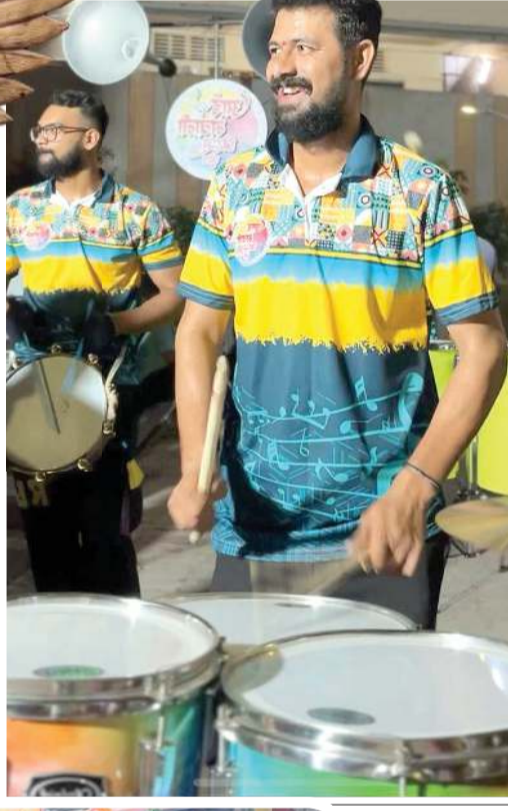
થીમ બેઝડ મંડપ ડેકોરેશનના એડવાન્સ બુકીંગ