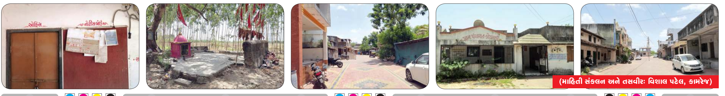
(માહિતી સંકલન અને તસવીર: વિશાલ પટેલ, કામરેજ)

ગામનાં વિવિધ ફળિયાં ગામ એકદમ નાનું હોવાથી ગામમાં પટેલ ફળિયું, માહાવંશી ફળિયું, ટાંકી ફળિયું, કોલોની ફળિયું આવેલું છે.