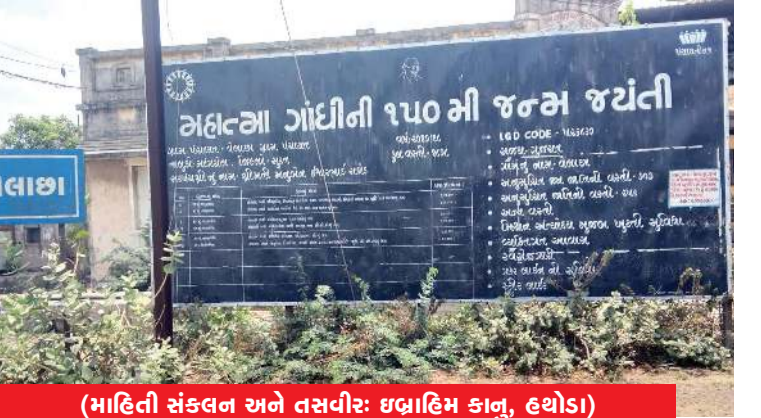
(માહિતી સંકલન અને તસવીર: ઇલાહિમ કાનુ, હથોડા)

વેલાછા ગામની ભાગોળે આવેલી ફેક્ટરીઓ લોકો માટે આશીર્વાદને બદલે જોખમી બની ગઈ છે. સ્થાનિક લોકોના જણાવ્યાનુસાર આ ફેક્ટરીઓ ખાસ કરીને રાત્રિના સમયે મોટા પ્રમાણમાં ઝેરી પ્રદૂષણ ઓકે છે. જેના કારણે સમગ્ર વિસ્તારમાં હવાની ગુણવત્તા બગડી છે અને ગામજનોને શ્વાસ લેવામાં પણ ભારે તકલીફ પડી રહી છે. ગામમાં કોઈ ગંભીર પ્રકારનો રોગચાળો ફેલાય તે પહેલાં, જવાબદાર તંત્ર અને પ્રદૂષણ નિયંત્રણ બોર્ડ દ્વારા આ ફેક્ટરીઓ સામે કડક પગલાં ભરી તાત્કાલિક તપાસ કરવામાં આવે તેવી લોકમાંગ ઊઠી છે.