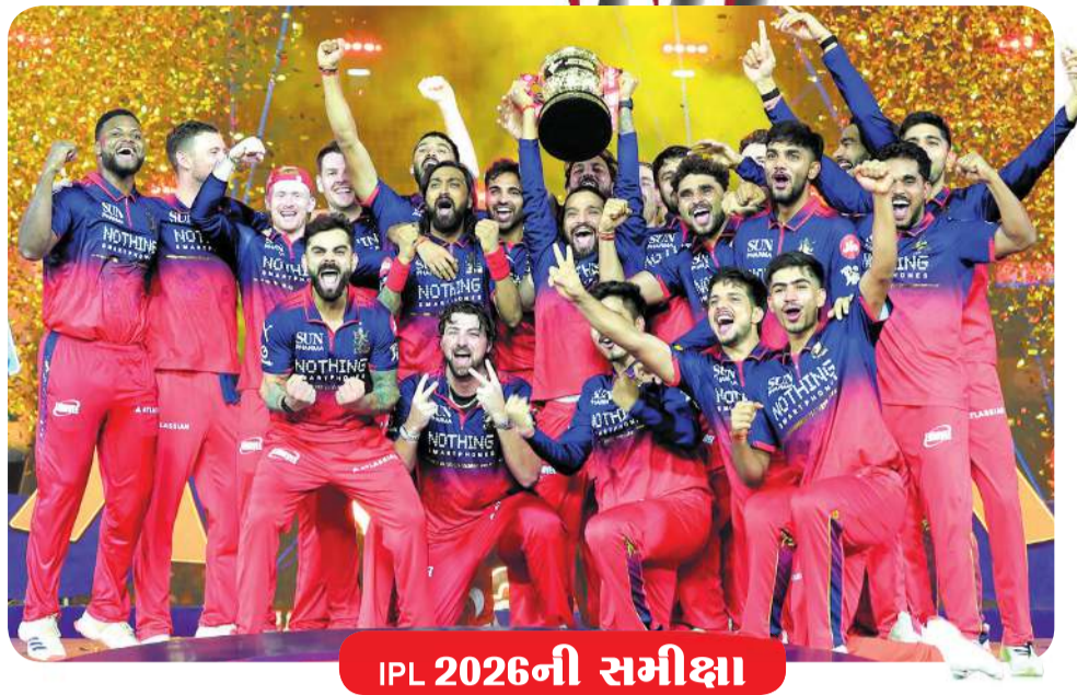
IPL 2026ની સમીક્ષા

રોયલ ચેલેન્જર્સ બેંગલુરુ (RCB) ૧૮ વર્ષ સુધી IPL ટાઇટલ માટે તરસનારી આ ફ્રેન્ચાઇઝીએ ગત સીઝનની ઐતિહાસિક જીત બાદ બાલે જીતવાની આદત જ પાડી દીધી છે. એન્ડી ફ્લાવર અને મો બોબેટના નેતૃત્વમાં મેનેજમેન્ટે એક એવી રોમિયન ટીમ તૈયાર કરી છે જે મેદાન પર શાનદાર પ્રદર્શન કરી રહી છે. RCB ઈચ્છશે કે નજીકના ભવિષ્યમાં કોઈ મોટા ઓફિસના ન થાય, કારણ કે ટીમના મોટાભાગના ખેલાડીઓ સીઝન દર સીઝન પોતાની રમતને વધુ બહેતર બનાવી રહ્યા છે. આ સીઝનમાં તેમનો ઈરાદો પોતાના ટાઇટલનો બચાવ કરવાનો નહીં, પરંતુ આક્રમક રીતે બીજી ટ્રોફી જીતવાનો હતો, અને તેઓ મેદાન પર તે મુજબ જ રમ્યા. સુપરસ્ટાર વિરાટ કોહલી કરિયરના આ તબક્કે પણ “યુવા ખેલાડીઓ” સાથે સ્પર્ધા કરવા માટે પોતાની રમતમાં સતત નવો બદલાવ લાવી રહ્યો છે. સચિન તેંડુલકરના મતે ભુવનેશ્વર કુમારે પોતાની શાનદાર “બોબલી સીમ” બોલિંગથી યુવા દિવસોની ચાલ તાજી કરાવી દીધી હતી. તેને ટૂર્નામેન્ટના બીજા ભાગમાં જોશ હેઝલવુડનો સારો સાથ મળ્યો. ફ્રાણ્સ પંડરાએ પોતાની વિવિધતાભરી બોલિંગથી ચોકાવ્યા અને પાંચમું IPL ટાઇટલ જીતવા તરફ કદમ વધાર્યા, જ્યારે ફાસ્ટ બોલર રસિખ દાર પણ આ સીઝનમાં ઘણો પરિપક્વ દેખાયો. દેવદત્ત પડિકલે આધુનિક T20ની જરૂરિયાતોને પહોંચી વળવા પોતાની પરંપરાગત રમતમાં સ્પષ્ટ ફેરફારો કર્યા, જ્યારે કેપ્ટન રજત પાટીદારે પોતાના મેચ-વિનિંગ પ્રદર્શનથી રાષ્ટ્રીય પસંદગીકારોનું ધ્યાન ખેંચ્યું. વેંકટેશ અચ્ચરને ટૂર્નામેન્ટના અંતિમ તબક્કામાં ‘ઇમ્પેક્ટ પ્લેયર’ તરીકે લાવવામાં આવ્યો હતો અને તેણે પણ સારું પ્રદર્શન કર્યું. RCB આ ટૂર્નામેન્ટની સૌથી સંતુલિત અને સંપૂર્ણ ટીમ દેખાતી હતી.