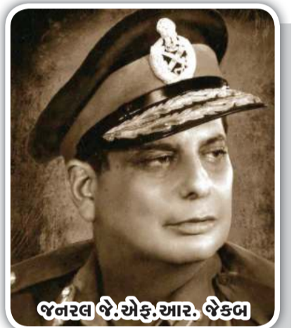
જનરલ જે.એફ.આર. જેકબ