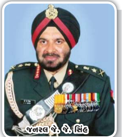
જનરલ જે. જે. સિંહ

આ પુસ્તકો પર નજર કરતાં એ ચોક્કસ કહી શકાય કે યુદ્ધ અને યોદ્ધાઓની આ કથાઓ ખરેખર રમ્ય છે.