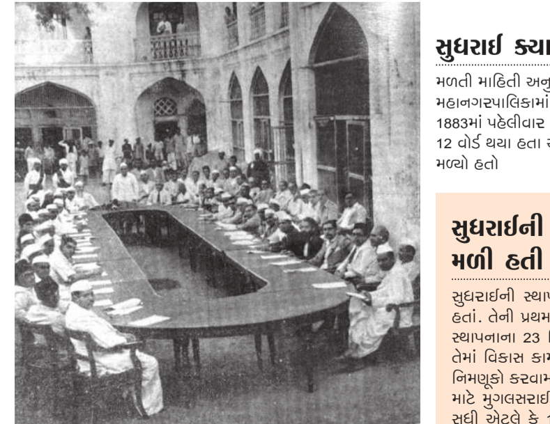
સુધરાઈની ચાલુ સભાનું દૃશ્ય (1952)

ઇતિહાસના પુસ્તકોમાંથી જાણવા મળે છે કે, 1846ની સાલમાં સુધરાઈએ કરવા જેવા કામોની જવાબદારી જિલ્લા જજ સંભાળતા હતા. સુધરાઈની સ્થાપનાને લઈને સુરતના લોકોની એક સભા મળી હતી પણ તેનું કોઈ પરિણામ દેખાયું નહીં. મોટાભાગના લોકોને સુધરાઈની સ્થાપના થવાથી શું ફાયદો થશે તેની સમજ નહીં હતી. લોકોને એવો ભય હતો કે આગળના રાજકાળમાં જકાતનો જે ત્રાસ વેઠવો હતો તેવો જ ત્રાસ ભોગવવાનો આવશે. લોકોની આ વિચારધારાને કારણે સુધરાઈની સ્થાપનાને લઈને લોકોનું વલણ પ્રતિકૂળ હતું.