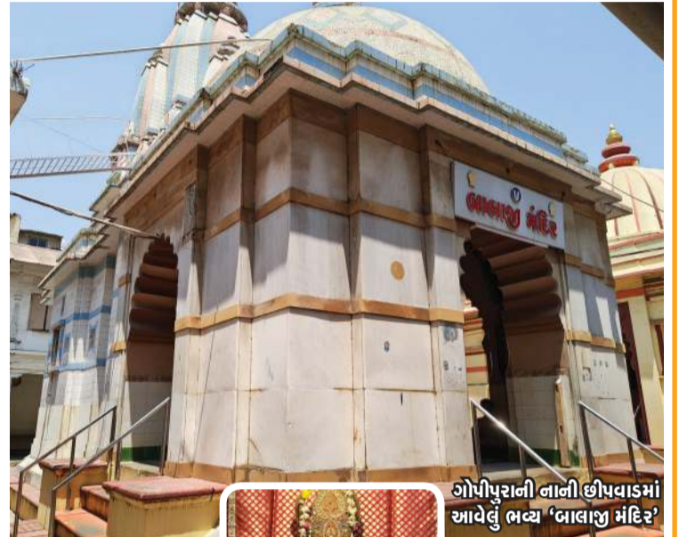
ગોપીપુરાની નાની છીપવાડમાં આવેલું ભવ્ય 'બાલાજી મંદિર'