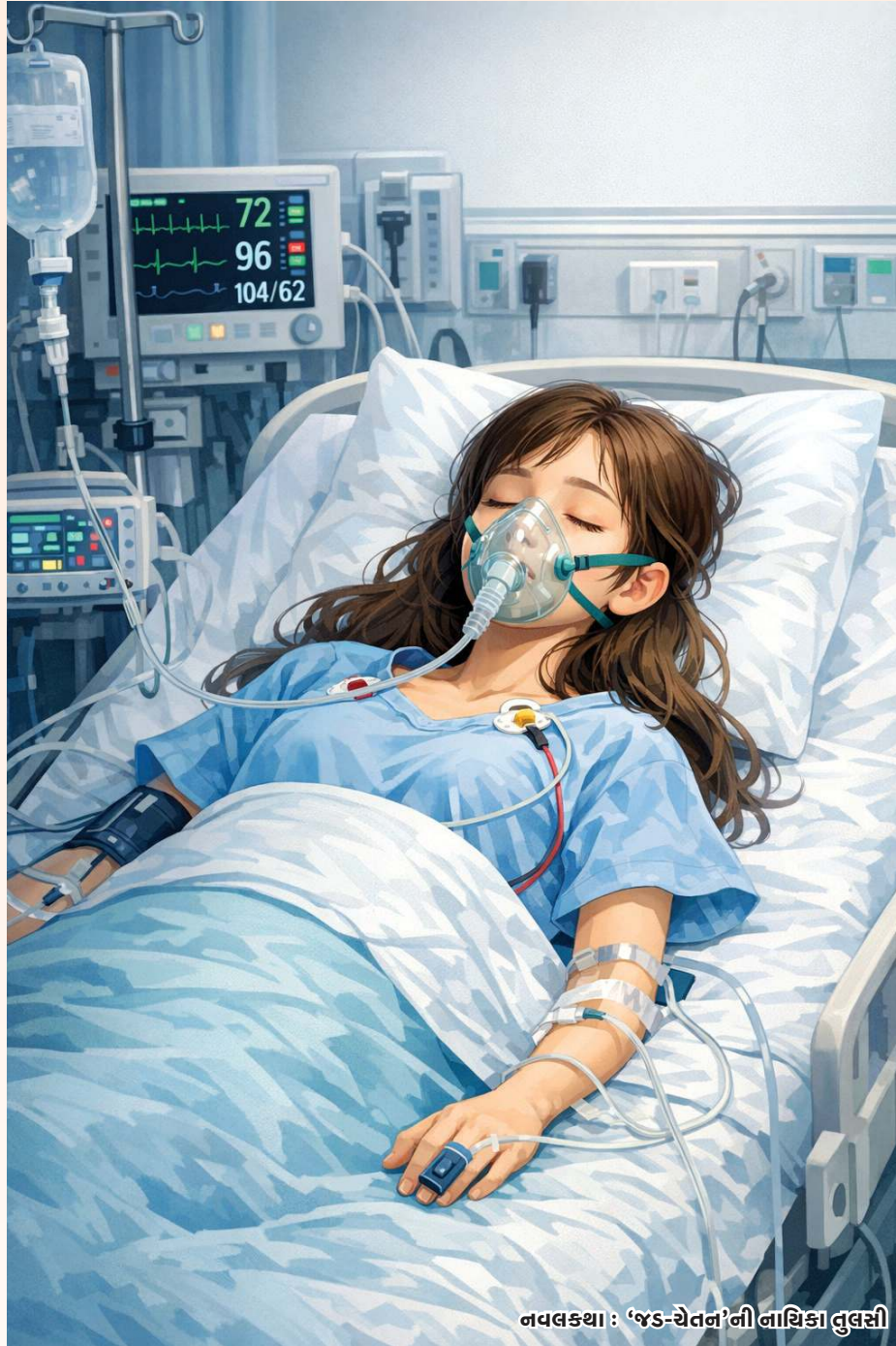
નવલકથા : ‘જડ-ચેતન’ની નાયિકા તુલસી

આ ઘટના છે ૧૯૮૪ની. એ વખતે ‘ચિત્રલેખા’માં હરકિસનભાઈની ધારાવાહિક નવલકથા ‘જડ-ચેતન’ પ્રકાશિત થઈ રહી હતી. કથાના મુખ્ય પાત્ર નર્સ તુલસી પર હોસ્પિટલનો એક વોર્ડબોય કાશીનાથ બળાત્કાર કરવાનો પ્રયાસ કરે છે. બન્ને વચ્ચે ઝપાઝપી થાય છે તેમાં ધવાયેલી નર્સ તુલસી કોમામાં સરી પડે છે. એ વખતે તુલસીના પાત્રે વાયકોનાં ચિત્ત