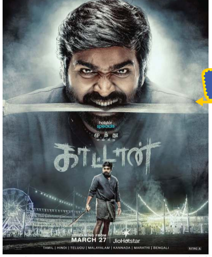
મુલ્યુ એક જ વ્યક્તિ હતો, પણ તેના અલગ અલગ જીવન અને વ્યક્તિત્વ એટલા વિરોધાભાસી હતા કે તે એક સમયે શાંત અને સાદો લાગતો, તો બીજા સમયે જંગલી અને ખતરનાક (કાઢાન) લાગતો. તે પૈસાવાળો હતો પણ પૈસાની પરવા કરતો ન હતો. તેને કુટુંબ ન હતું, પણ તે એક વ્યવસાયી (મિલિંદ સોમન)

સા ઉપના જાણીતા સુપરસ્ટાર વિજય સેતુપથીની ફરીથી દર્શકોનું દિલ જીતવા વેબ સિરિઝ 'કાઢાન'માં જોવા મળવાના છે. એમ. મણિકંદનની આ નવી સિરીઝ 'કાઢાન' (મૂળ નામ: મુલ્યુ ઓગિરા કાઢાન) ખૂબ જ રસપ્રદ અને ધીમી ગતિએ આગળ વધતી વાર્તા છે, જેમાં વિજય સેતુપતિ મુખ્ય ભૂમિકામાં છે. સીરીઝની વાર્તા કંઈક આમ છે કે એક નાનકડા પોલીસ સ્ટેશનને બંધ કરવાની તૈયારી ચાલી રહી છે કારણ કે ત્યાં કોઈ કેસ જ નથી થતો. ત્યાં એક પોલીસવાળાને જંગલની નજીક એક માણસનું કપાયેલું માથું મળે છે. આ માથું વિજય સેતુપતિનું છે અને તેના મોં પર એક અજીબ હાસ્ય છે. આ માથાની તપાસ કરતાં પોલીસને ખબર પડે છે કે આ માણસ મુલ્યુ (ઉપનામ કાઢાન) અનેક અલગ અલગ જીવન જીવ્યો હતો. ક્યારેક તે નાચની ટુકડીમાં બોડીગાર્ડ હતો. ક્યારેક ઘડિયાળ સરસામાનનો કારીગર હતો. ક્યારેક હાથીનો માહાવત હતો. ક્યારેક બકરીઓના છાણ ખરીદતો હતો અને ક્યારેક એક ધનાઢ્ય વ્યક્તિના ઓર્કેસ્ટ્રાનું સંચાલન કરતો હતો