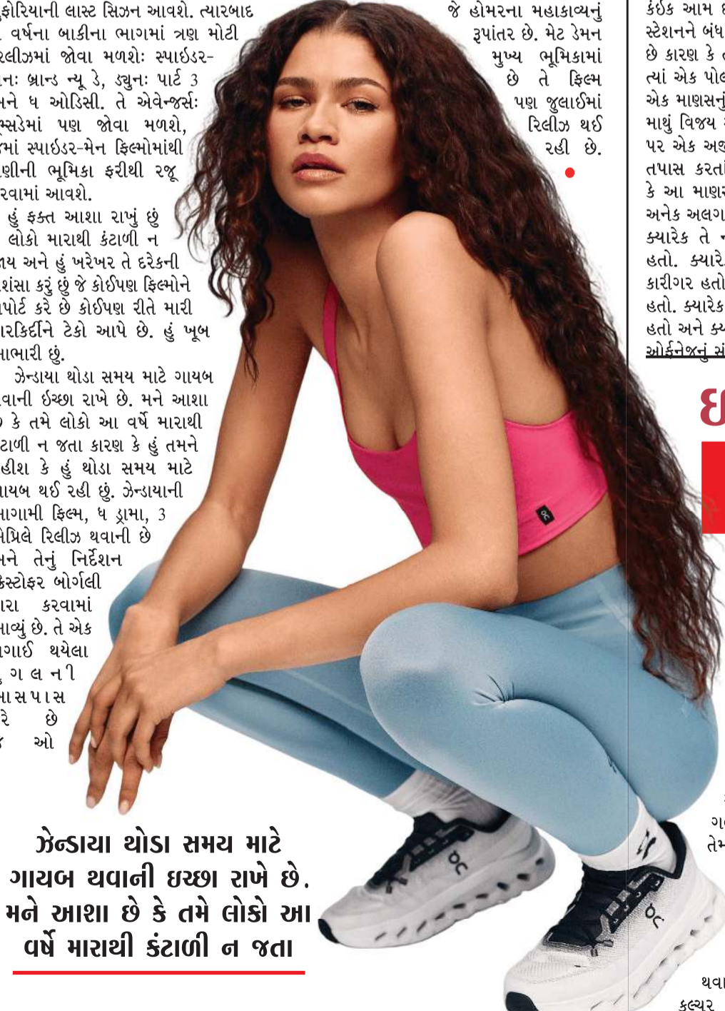
એન્ડાયા થોડા સમય માટે ગાયબ થવાની ઈચ્છા રાખે છે. મને આશા છે કે તમે લોકો આ વર્ષે મારાથી કંટાળી ન જતા