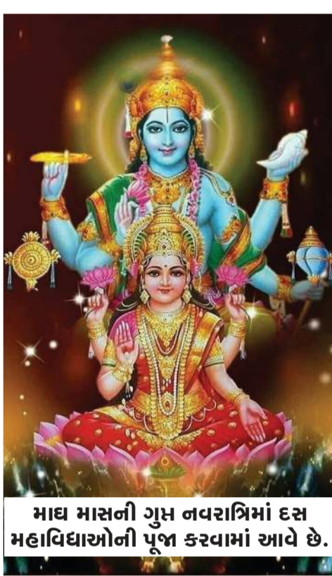
માઘ માસની ગુપ્ત નવરાત્રિમાં દસ મહાવિધાઓની પૂજા કરવામાં આવે છે.

હિંદુ કેલેન્ડર અનુસાર માઘ માસ 14 જાન્યુઆરીથી પ્રારંભ થઈ ગયો છે. આ મહિનો આધ્યાત્મિક અને ધાર્મિક દૃષ્ટિએ અત્યંત શુભ માનવામાં આવે છે. માઘની શરૂઆત સાથે જ ખરમાસનું સમાપન પણ થાય છે જેના કારણે લગ્ન, વિવાહ, મુંડન, જનોઈ, ગૃહ પ્રવેશ, સગાઈ અને નવી ગાડી અથવા વાહનની ખરીદી જેવાં શુભ કાર્ય આરંભ થાય છે. આ મહિનામાં ભગવાનની પૂજા અને જરૂરિયાતવાળાને દાન આપવાનું વિશેષ મહત્ત્વ છે. માઘ માસને સનાતન ધર્મમાં અત્યંત શુભ માનવામાં આવે છે. આ વિશેષ મહિનામાં સ્નાન, દાન, વ્રત અને તપનું વિશેષ મહત્ત્વ હોય છે. ધાર્મિક પરંપરા અનુસાર માઘ માસમાં વિધિપૂર્વક શ્રી હરિ, મા લક્ષ્મી અને તુલસી માતાની પૂજા કરવાથી સુખ અને સમૃદ્ધિમાં વૃદ્ધિ થાય છે. આવો જાણીએ કે, માઘ માસમાં ક્યાં કાર્ય કરવાં જોઈએ. હિંદુ પંચાંગ અનુસાર માઘ મહિનાની શરૂઆત દર વર્ષે મકરસંક્રાંતિના દિવસે થાય છે. આ વર્ષે માઘ મહિનો 14 જાન્યુઆરી 2025 થી પ્રારંભ થઈ ચૂક્યો છે અને 12 ફેબ્રુઆરી 2025 રોજ સમાપ્ત થશે. માઘ માસમાં દરરોજ ભગવાન વિષ્ણુ અને માતા લક્ષ્મીની આરાધના કરવી જોઈએ. શક્ય હોય તો નાનો વિષ્ણુ યાગ ધરમાં કરવો જોઈએ. સાથે સાથે માતા લક્ષ્મીજીનો શ્રીસુકતના પાઠથી ઉત્તમ પૂજા-હવન જાણકાર પાસે કરાવવો જોઈએ. ભગવાન વિષ્ણુ-લક્ષ્મીના આ પ્રિય મહિનો છે તેથી તેનું ફળ સો ટકા મળે. આ મહિને વિશેષ વસ્તુઓનું દાન કરવું અત્યંત મહત્ત્વપૂર્ણ છે. પૂજા સમયે ગીતાનો પાઠ અવશ્ય કરવો જોઈએ. માઘ માસમાં શુભ તિથિઓ પર પવિત્ર નદીઓમાં સ્નાન કરવું લાભકારક હોય છે. આ સિવાય માઘ મહિનામાં દરરોજ તુલસી માતાની પૂજા કરવી પણ આવશ્યક છે.