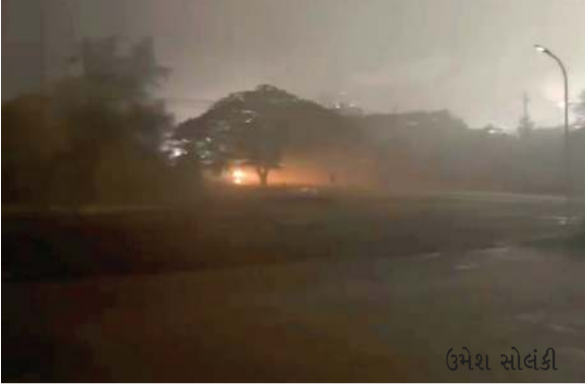
કેમિકલ કંપનીઓ આવેલી છે. વર્ષોથી સરીગામ કચરાગામ માંડા અણગામ સહિત આજુબાજુના ગામના લોકો હવા વાયુ પાણી પ્રદૂષણને લઈને ભારે પરેશાની વેઠી રહ્યા છે. શુક્રવારે સાંજના રાતના સમયે સરીગામ ફણસા રોડ ઉપર વાયુ પ્રદૂષણ જોવા મળ્યું હતું. વાયુ પ્રદૂષણ ગાઢ ધુમ્મસથી અનેથી પસાર થતાં લોકો ડાહ્યાકી વેકતા જોવા મળ્યા હતા. કોઈક કંપની દ્વારા વરસાદની આડમાં

કોઈક કંપની દ્વારા વરસાદની આડમાં ગેસ પ્રદૂષણ ફેલાવાઈ રહ્યાની સ્થાનિકોમાં આશંકા ઉમરગામ: સરીગામમાં વાયુ પ્રદૂષણથી આંખમાં બળતરા શ્વાસ લેવામાં તકલીફ થઈ હોવાની ફરિયાદો ઊભા પામી છે. અગ્રણીઓએ ચિંતા વ્યક્ત કરી GPCBને તપાસ માટે ફરિયાદ કરી છે. પ્રાપ્ત સૂત્રો પાસેથી મળતી વિગતો મુજબ ઉમરગામ તાલુકાના સરીગામ ઔદ્યોગિક વિસ્તારમાં નાની મોટી અનેક