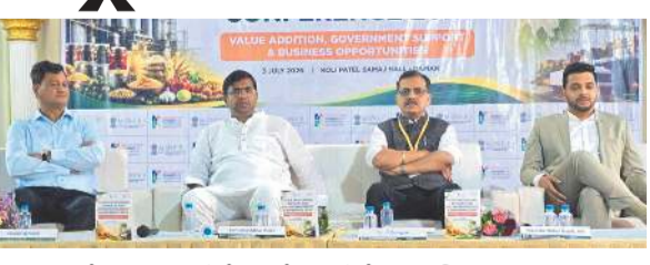
સહાય જૂથો, MSME ઉદ્યોગકારો, સ્ટાર્ટઅપ અને યુવાનો ઉપસ્થિત રહ્યા હતાં. સાંસદ ઉમેશભાઈ પટેલે જણાવ્યું હતું કે, માત્ર ઉત્પાદન નહીં પરંતુ વેલ્યુ એડિશન, આધુનિક પ્રોસેસિંગ, બ્રાન્ડિંગ અને નિકાસ દ્વારા ખેડૂતો, માછીમારો અને નાના ઉદ્યોગકારોની આવકમાં વધારો શક્ય છે. તેમણે ખેડૂતોને ખેતીને પ્રોસેસિંગ ઉદ્યોગ સાથે જોડવા, મહિલા SHG ને સ્થાનિક ઉત્પાદનોની બ્રાન્ડિંગ કરવા અને યુવાનોને રોજગાર શોધવાને બદલે

સાંસદ ઉમેશ પટેલે કેન્દ્ર સરકાર સમક્ષ વિકાસના ૧૦ મુદ્દાનો રોડમેપ રજૂ કર્યો દમણ: દમણમાં ભારત સરકારના પાદ્ય પ્રોસેસિંગ ઉદ્યોગ મંત્રાલય (MOFPI) ના સહયોગથી ફૂડ પ્રોસેસિંગ, નિકાસ અને ઉદ્યોગસાહસિકતા પરિષદ - 2026નું આયોજન ભેંસલોર ચાર રસ્તા પાસે આવેલ ડ્રોળી પટેલ સમાજના હોલમાં યોજાયું હતું. આ પરિષદમાં સાંસદ ઉમેશભાઈ પટેલ સાથે દમણ ઈન્ડસ્ટ્રિયલ એસોસિયેશનના અધ્યક્ષ, MOFPI, NABARD, APEDA સહિત વિવિધ કેન્દ્રીય સંસ્થાઓના અધિકારીઓ તથા ખેડૂતો, માછીમારો, મહિલા સ્વ