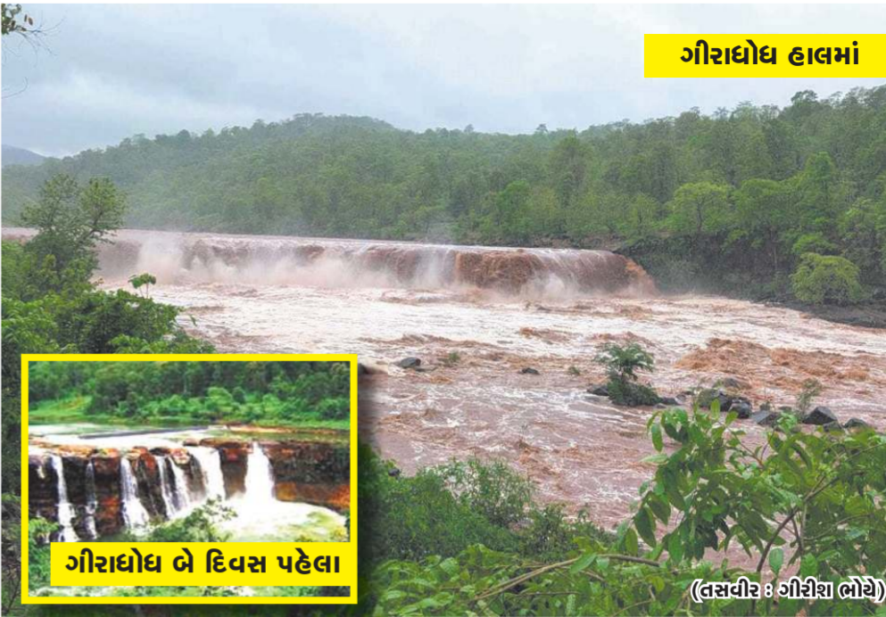
ગીરાધોધ બે દિવસ પહેલા