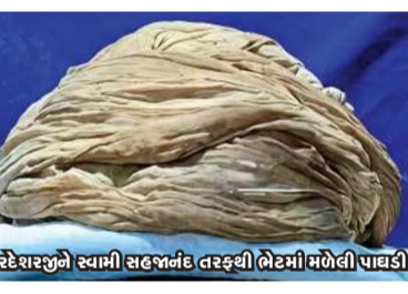
અરદેશરજીને સ્વામીજીએ આપેલી પાઘડી