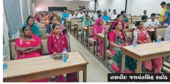
ભાજપના સદસ્ય 'ભૂગર્ભ' માં ઉતરી ગયાં

ખેડા જિલ્લા પંચાયતની ૨૦૨૩માં યોજાઈ હતી. આ ત્રણ અગાઉની સામાન્ય સભા વર્ષ વર્ષના ગાળા બાદ ખેડા જિલ્લા