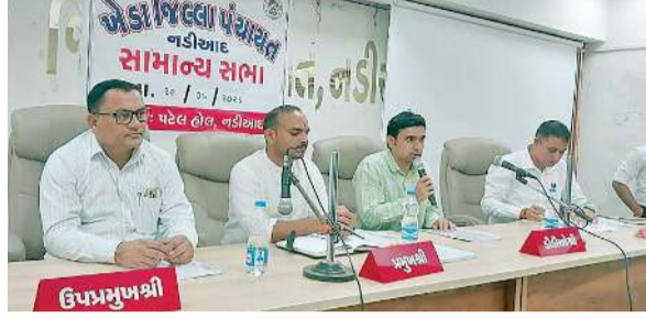
વિવિધ સમિતિઓની રચના અને ચેરમેનોની ચરણી

ગેરહાજરી અને સંકુલમાં થયેલી ચોરીની ઘટનાએ સુરક્ષા સામે સવાલો ઉભા કર્યાં હતાં. આ ઉપરાંત, મહેમદાવાદના મોદજમાં સરકારી પશુ દવાખાનાના નિર્માણ માટે જરૂરી જમીન ફાળવવાનો ઠરાવ પણ મંજૂર કરાયો હતો. સૌથી મહત્વની બાબત એ છે કે, નવા અસ્તિત્વમાં આવનારી પંચાયતોમાં વહીવટી સરળતા માટે નવી ગ્રામ પંચાયતો રચવાની મંજૂરી અપાઈ છે, જેમાં અલવા (કપડવંજ)માંથી હિરાપુરા તેવી જ રીતે સલૂણવાંટાં (નડિયાદ)માંથી જોષીપુરા, સોડપુરમાંથી મુલેસરા, કાશીયેલ (કઠલાલ)માંથી વડવાળા અને ભગતના મુવાડામાંથી સિપાઈના મુવાડી અને ઘોઘાવાડામાંથી રઘુનાથપુરાનો સમાવેશ થાય છે.