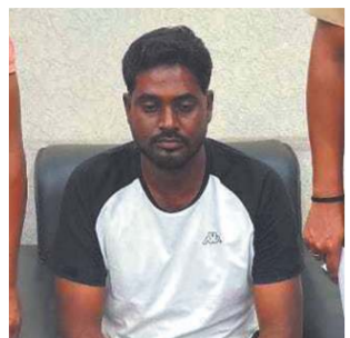
દિલ્હીમાં કોર્કેઈન લેવા પેસલર મુંબઈથી દિલ્હી ફ્લાઈટમાં ગયો હતો