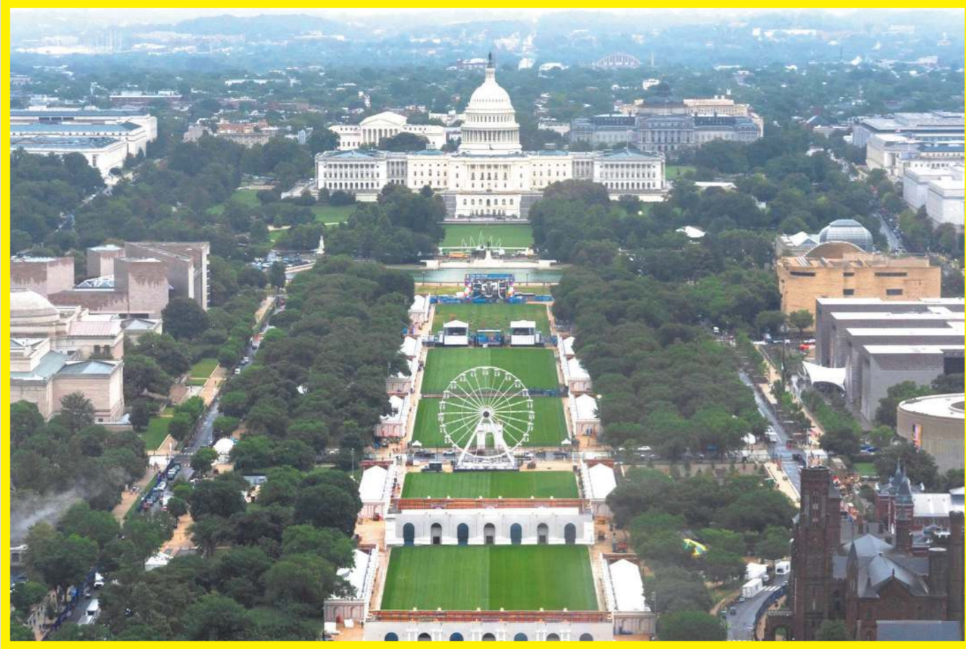
યુ.એસ.ની આગ્રાદીની ૨૫મી વર્ષગાંઠની ઉજવણીના ભાગરૂપે વોશિંગ્ટન ડી.સી.માં યુ.એસ. કેપિટલ બિલ્ડિંગ અને ફિફા ફેન ઝોન નજીક નેશનલ મોલ ખાતે 'ફ્રીડમ ૨૫૦ ઓલ' (ફ્રીડમ ઓલ).