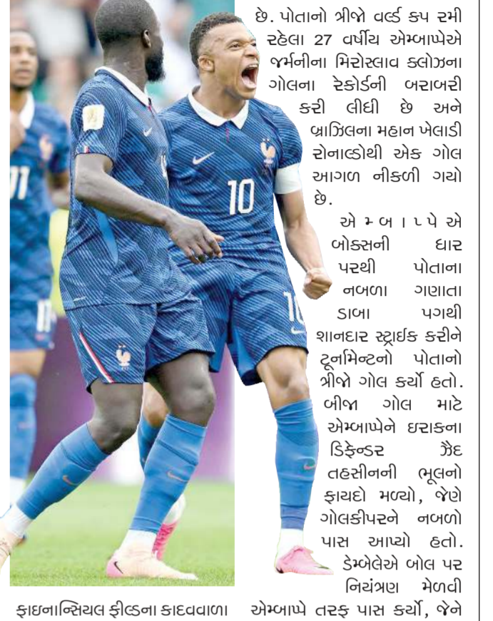
ફ્રાન્સના નિયંત્રણ હેઠળના કાલવાળા ઘાસ પરથી પાણી હટાવવાની ફરજ પડી હતી. હવામાન ગમે તેવું હોય, પણ આ મેચ એમબાપેના નામે રહી. તે વર્લ્ડકપમાં સૌથી વધુ ગોલ કરવાના મામલે નવા રેકોર્ડ હોલ્ડર લિયોનેલ મેસીનો પીછો રહ્યો

વર્લ્ડકપમાં સર્વાધિક ગોલ મામલે એમબાપે મિરોસ્લાવ ક્લોઝની બરાબરીએ મેસીથી બે ગોલ પાછળ ફિલાડેલ્ફિયા, તા. 23 : ફિફા વર્લ્ડકપમાં પ્રથમ વરસાદી વિદ્ય વચ્ચે સોમવારે ઇરાકને 3-0થી હરાવીને નોકઆઉટ સ્ટેજમાં પ્રવેશ કરી લીધો છે. આ મેચમાં કિલીયાન એમબાપેએ બે ગોલ કરીને વર્લ્ડકપ કરિયરમાં સૌથી વધુ ગોલ કરનારા ખેલાડીઓની યાદીમાં 16 ગોલ સાથે સંયુક્ત રીતે બીજું સ્થાન મેળવ્યું છે. ફ્રાન્સ વતી ઓસ્માન ડેમ્બેલેએ પણ એક ગોલ કર્યો હતો, જેનાથી ફિલાડેલ્ફિયાની વરસાદી રાત્રે સ્ટેડિયમમાં ચોકચેલા પ્રશંસકો ખુશ થઈ ગયા હતા. એમબાપેએ 14મી અને 54મી મિનિટે ગોલ કરીને પોતાની 100મી આંતરરાષ્ટ્રીય મેચને યાદગાર બનાવી હતી. એમબાપેના પ્રથમ ગોલથી ફ્રાન્સ હાફ-ટાઇમ સુધી 1-0થી આગળ હતું. તે સમયે ભારે વરસાદ અને વાવાઝોડાને કારણે રમત બે કલાકથી વધુ સમય માટે રોકકવી પડી હતી, અને ગ્રાઉન્ડ સ્ટાફને લિંકન