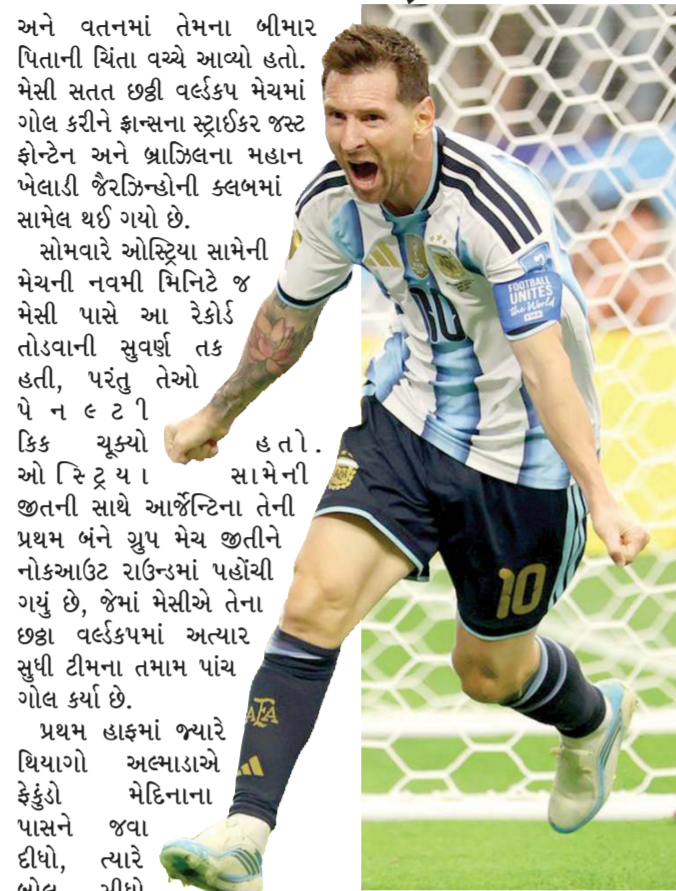
આશરે ૨૦ યાંડના અંતરે આવ્યો. મેસીએ શ્વેગરને થાપ આપીને

પહેલી મેચમાં હેટ્રિક કરનારા મેસીએ ઓસ્ટ્રિયા સામેની 2-0ની જીતમાં બંને ગોલ કરીયા વર્લ્ડકપમાં કુલ પાંચ ગોલ કર્યા મેસીએ 38મી મિનિટે ગોલ કરીને વર્લ્ડકપમાં સર્વાધિક ગોલનો રેકોર્ડ બનાવ્યો, સ્ટોપેજ ટાઇમમાં વધુ એક ગોલ કર્યો આર્લિંગ્ટન (ટેક્સાસ), તા. 23 : ફિફા વર્લ્ડકપમાં ગઈકાલે મોડી રાત્રે અહીં રમાયેલી એક મેચમાં લિયોનેલ મેસીએ વર્લ્ડકપમાં પોતાનો 17મો ગોલ કરીને સૌથી વધુ ગોલ કરવાનો નવો રેકોર્ડ બનાવ્યો અને તે પછી સ્ટોપેજ ટાઇમમાં વધુ એક ગોલ સાથે 18મો ગોલ કરતા રિક્સ્ટ્રોંગ ચેમ્પિયન આર્જેન્ટિનાને ઓસ્ટ્રિયા સામે 2-0થી જીત અપાવી હતી. મેસીનો વિક્રમી ઐતિહાસિક ગોલ મેચની 38મી મિનિટે આવ્યો હતો. ખાસ વાત એ છે કે આ ગોલ મેસીના 39મા જન્મદિવસના દિવસ પહેલાં