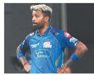
કર્મી હતો, પરંતુ તે સમયે રિલાયન્સની વાર્ષિક સામાન્ય સભા થવાની હતી, તેથી આઈપીએલ ટ્રેડ તેમની ટોચની પ્રાથમિકતા નહોતી. સૂત્રએ ઉમેર્યું કે જોકે, એ વાત સામે આવી છે કે કેકેઆરે ફરીથી મુંબઈ ઇન્ડિયન્સના ઉચ્ચ અધિકારીઓનો સંપર્ક કર્યો છે અને આ સંદર્ભમાં ચર્ચાના કેટલાક રાઉન્ડ પણ થયા છે. એ વાત ચોક્કસ છે કે જો હાર્દિક કેકેડ ડીલ અથવા ખેલાડીઓની અદલાબદલી દ્વારા કેકેઆરમાં જાય છે, તો તેને કેપ્ટનશીપ મળી શકે છે કારણ કે રિંકુ સિંહ હાલમાં યોગ્ય પસંદગી નથી લાગતી. જ્યારે તેમને પૂર્ણપણે આપ્યું કે શું મુંબઈની ટીમ સ્ટાર ભારતીય ઓલરાઉન્ડર માટે રસ ધરાવે છે તે સંબંધે છે કે ખેલાડીની અદલાબદલી ઈચ્છે છે, ત્યારે સૂત્રએ તેની પુષ્ટિ કરી ન હતી. એમઆઈટી તરફથી બીજા ઓફર યશસ્વી જયસ્વાલ અને પંડ્યા વચ્ચેના ટ્રેડની હોવામાં જાણવા મળે છે, પરંતુ કોઈ ખાતરીપૂર્વક કહી શકતું નથી કે વાતચીત આગળ વધી છે કે નહીં.

કેકેઆર ગત સિઝનના અંતમાં જ મુંબઈ ઇન્ડિયન્સના અધિકારીઓનો સંપર્ક કર્યો હતો અને હાલમાં ફરી એકવાર સંપર્ક કર્યો રાજસ્થાન રોયલ્સ સાથે મુંબઈ ઇન્ડિયન્સની હાર્દિક પંડ્યાની બદલીમાં ચર્ચાચી વચરવાલને ટ્રેડ કરવાની ઓફરના અહેવાલ નવી દિલ્હી, તા. 23 (પીટીઆઈ) : હાર્દિક પંડ્યા અને મુંબઈ ઇન્ડિયન્સ અલગ થવાના છે ત્યારે હાર્દિકને શાહરૂખ ખાનની સહ-માલિકીની નોંધવો નાઈટ રાઈડર્સ અને રાજસ્થાન રોયલ્સ તરફથી સંભવિત ટ્રેડ માટે ઓછામાં ઓછી બે ઓફર મળી છે. આઈપીએલના એક સૂત્રએ નામ