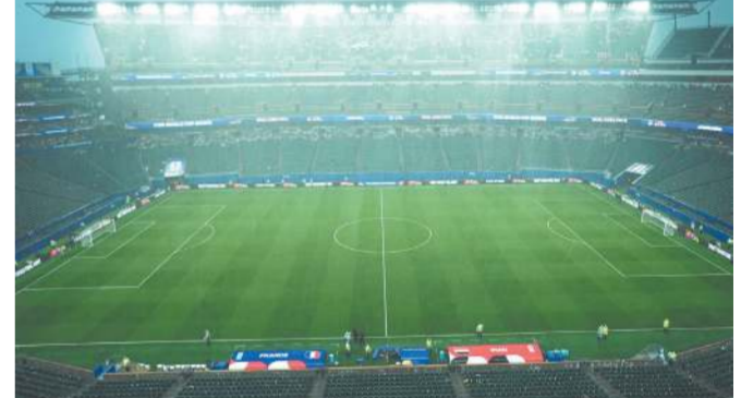
પડી હોય. આ વિલંબની જાહેરાત સ્થાનિક ફાઈનાન્સિયલ ફીલ્ડ સ્ટેડિયમમાં સમય મુજબ સાંજે છ વાગ્યાના થોડી મિનિટો પહેલાં કરવામાં આવી હતી અને રાત્રે આઠ વાગ્યે મેચ ફરી શરૂ થઈ હતી. હાફ-ટાઇમ સુધીમાં ફ્રાન્સ 1-0થી આગળ હતું ત્યારે જ સ્કોરબોર્ડ પર મેસેજ બતાવીને લિંકન ફાઈનાન્સિયલ ફીલ્ડ સ્ટેડિયમમાં હાજર દર્શકોને સ્ટેડિયમના સુરક્ષિત અને છતવાળા વિસ્તારોમાં આશરો લેવા જણાવવાનું હતું, તેમજ ચેતવણી આપવામાં આવી હતી કે ભારે તોફાન આવી રહ્યું છે.

ગાજવીજ સાથે ભારે વરસાદ અને તોફાની પવનને કારણે ફ્રાન્સ-ઈરાકની મેચમાં બે કલાકનો વિલંબ થયો ફિલાડેલ્ફિયા, તા. 23 (એપી) : ગાજવીજ સાથેના ભારે વરસાદ અને તોફાની પવનને કારણે ગઈકાલે સોમવારે ફ્રાન્સ અને ઈરાક વચ્ચેની વર્લ્ડકપ મેચમાં હાફ-ટાઇમ દરમિયાન બે કલાક કરતાં વધુ સમયનો વિલંબ થયો હતો. આ આખી ટુર્નામેન્ટમાં વરસાદના કારણે થયેલો પ્રથમ વિલંબ હતો, અને પાછલા કેટલાક દાયકાઓમાં આ પહેલીવાર બન્યું છે જ્યારે વર્લ્ડકપની કોઈ મેચને ખરાબ હવામાનને કારણે અવવચ્ચેથી રોકવી