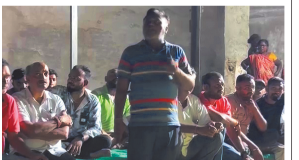
પંચાયતના સભ્ય અને ભૂતપૂર્વ તાલુકા પ્રમુખનું નામ મોખરે આવ્યું છે. સોશિયલ મીડિયા પર વાયરલ થયેલા વિડીયોમાં તેમની દાદાગીરી સ્પષ્ટ દેખાય છે, જેમાં તેઓ ધમકી આપી રહ્યા છે કે જે કોઈ ગ્રામજન આ પરિવાર સાથે સંબંધ રાખશે તે તેને પણ બહિષ્કાર કરાશે. આ કથિત 'તાલીબાની ફતવામાં' મહિલા સભ્યના પતિ સહિત કેટલાક સ્થાનિક કરવો આગેવાનો પણ સામેલ હોવાનું ચર્ચાઈ રહ્યું છે, જેના કારણે ગામમાં ભારે અર્જનો અને વગવિગ્રહની સ્થિતિ સર્જાઈ છે. માનવતા અને લોકશાહીને શરમાવતો આ ઘટનાના પડઘા ગાંધીનગર મુખ્યમંત્રી કાર્યાલય સુધી પહોંચ્યા છે. આ તાલીબાની ફતવા મામલે

કવિઠામાં પરિવારના શાકભાજી, દવા અને ફરિયાદો સહિતના તમામ વ્યવહારો બંધ કરી દેવાયા