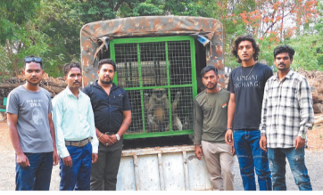
કુકરમુંડા: નંદુરબાર જિલ્લાના અક્કલકૂવા વિસ્તારમાં છેલ્લા ૧૫ દિવસથી આતંક મચાવનાર અને ૮ લોકોને ઘાયલ કરનાર વાંદરોના વન વિભાગે સફળતાપૂર્વક પકડી