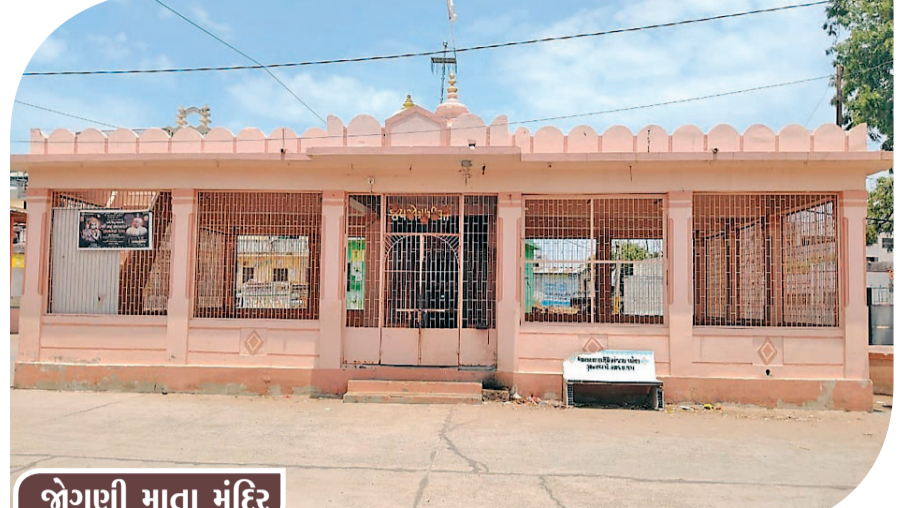
જોગણી માતા મંદિર

ખંભા તાલુકાનું જલુંધ ગામ આસ્થા, આધ્યાત્મિકતા, સંસ્કૃતિ અને સામાજિક સમરસતાનું જીવંત પ્રતિક માનવામાં આવે છે. અઢારે વર્ષની વસ્તી ધરાવતું આ ગામ વર્ષોથી ધાર્મિક ભાવના, પરસ્પર પ્રેમ અને સહઅસ્તિત્વની પરંપરા જાળવી રાખી રહ્યું છે. અહીં વિવિધ સમાજ અને સંપ્રદાયના લોકો વસવાટ કરે છે, છતાં નાત-જાત કે વર્ણના કોઈપણ ભેદભાવ વગર સમગ્ર ગામ એક પરિવારની જેમ દરેક ધાર્મિક પ્રસંગોમાં સહભાગી બને છે. આ જ વિશેષતા જલુંધને સમગ્ર પંથકમાં આગવી ઓળખ અપાવે છે. ગામમાં આવેલા અનેક પ્રાચીન મંદિરો અને દેવસ્થાનો આજે પણ ગ્રામજનોની અતૂટ શ્રદ્ધાના કેન્દ્ર છે. ગામ ટોળાની જોગણી માતાનું મંદિર, વેરાઈ માતાજીનું મંદિર, રાધાકૃષ્ણ મંદિર, નીલકંઠ મહાદેવ, બળીયાદેવ, તેમજ બાપજી મહારાજનું સ્થાનક વર્ષોથી ધાર્મિક આસ્થાનું પ્રતિક બની રહ્યા છે. અહીં નિયમિત રીતે પૂજા-અર્ચના, ભજન-