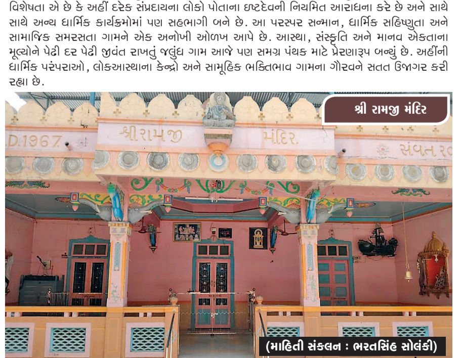
(માહિલી સંકલન : ભરતસિંહ સોલંકી)

તાલુકામાં વિશેષ આકર્ષણનું કેન્દ્ર ગણાય છે. લોકમાન્યતા છે કે તાલુકામાં સૌથી ઉત્સાહભરે અને ભવ્ય રીતે ઉજવાતી નવરાત્રિઓમાં જલુંધ ગામનું સ્થાન અગ્રણી છે. નવ દિવસ સુધી ગામમાં માતાજીની આરાધના, આરતી, ગરબા અને વિવિધ ધાર્મિક કાર્યક્રમોનું આયોજન થાય છે. સમગ્ર ગામ રંગબેરંગી રોશની અને ભક્તિમય વાતાવરણથી ઝળહળી ઊઠે છે. નવરાત્રિના દિવસોમાં ગામ બહારથી તેમજ અન્ય જિલ્લાઓમાંથી હજારો લોકો અહીં ગરબા નિહાળવા અને માતાજીના દર્શન કરવા આવે છે. ગામના યુવાનો, મહિલાઓ અને વડીલો સૌ મળીને આયોજનને સફળ બનાવે છે. ભક્તિ અને લોકસંસ્કૃતિનો આ સંગમ જલુંધ ગામની આગવી ઓળખ બની ગયો છે. જલુંધ ગામની સૌથી મોટી વિશેષતા એ છે કે અહીં દરેક સંપ્રદાયના લોકો પોતાના ઇષ્ટદેવની નિયમિત આરાધના કરે છે અને સાથે સાથે અન્ય ધાર્મિક કાર્યક્રમોમાં પણ સહભાગી બને છે. આ પરસ્પર સન્માન, ધાર્મિક સહિષ્ણુતા અને સામાજિક સમરસતા ગામને એક અનોખી ઓળખ આપે છે. આસ્થા, સંસ્કૃતિ અને માનવ એકતાના મૂલ્યોને પેઢી દર પેઢી જીવંત રાખતું જલુંધ ગામ આજે પણ સમગ્ર પંથક માટે પ્રેરણારૂપ બન્યું છે. અહીંની ધાર્મિક પરંપરાઓ, લોકઆસ્થાના કેન્દ્રો અને સામૂહિક ભક્તિભાવ ગામના ગૌરવને સતત ઉજાગર કરી રહ્યા છે.