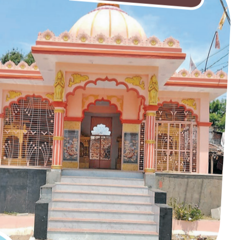
વોતર માતા મંદિર