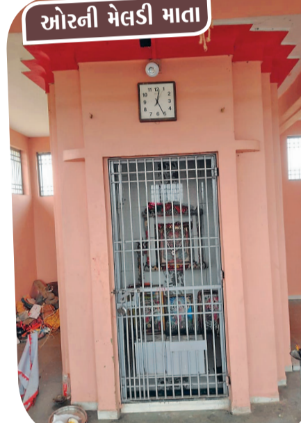
ઓરની મેલડી માતા

કીર્તન, સત્સંગ અને ધાર્મિક કાર્યક્રમો યોજાતા રહે છે. વર્ષ દરમિયાન આવતાં વિવિધ હિંદુ તહેવારો, ધાર્મિક પર્વો અને ઉત્સવોમાં સમગ્ર ગામ ઉમંગ અને ભક્તિભાવ સાથે ખેડાય છે. મંદિર પરિસરોમાં ભક્તિમય વાતાવરણ સર્જતું હોય છે, જે ગામની આધ્યાત્મિક ઓળખને વધુ મજબૂત બનાવે છે. જલુંધ ગામની ધાર્મિક ઓળખમાં સૌથી વિશેષ સ્થાન સાક્ષાત દેવી સ્વરૂપ ઓરના ઝંડાની મેલડી માતાજીનું છે. સમગ્ર પંથકમાં આ સ્થાન અત્યંત ચમત્કારિક અને શ્રદ્ધાનું કેન્દ્ર માનવામાં આવે છે. ગ્રામજનો માતાજીને પોતાની કુલદેવી અને રક્ષક શક્તિ તરીકે પૂજે છે. ખાસ કરીને દર રવિવારે ગામ ઉપરાંત આસપાસના વિસ્તારો અને અન્ય ગામોમાંથી પણ મોટી સંખ્યામાં ભાવિકો દર્શનાર્થે આવે છે. અનેક લોકો પોતાની