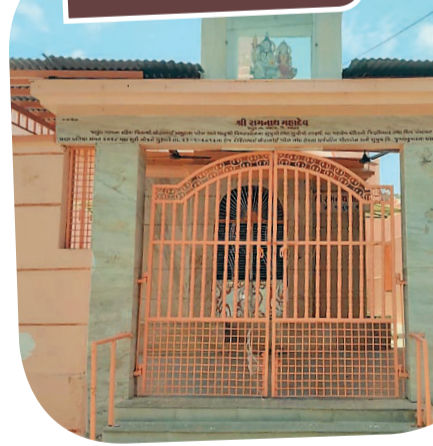
શ્રી રામજી મંદિર

તાલુકામાં વિશેષ આકર્ષણનું કેન્દ્ર ગણાય છે. લોકમાન્યતા છે કે તાલુકામાં સૌથી ઉત્સાહભરે અને ભવ્ય રીતે ઉજવાતી નવરાત્રિઓમાં જલુંધ ગામનું સ્થાન અગ્રણી છે. નવ દિવસ સુધી ગામમાં માતાજીની આરાધના, આરતી, ગરબા અને વિવિધ ધાર્મિક કાર્યક્રમોનું આયોજન થાય છે. સમગ્ર ગામ રંગબેરંગી રોશની અને ભક્તિમય વાતાવરણથી ઝળહળી ઊઠે છે. નવરાત્રિના દિવસોમાં ગામ બહારથી તેમજ અન્ય જિલ્લાઓમાંથી હજારો લોકો અહીં ગરબા નિહાળવા અને માતાજીના દર્શન કરવા આવે છે. ગામના યુવાનો, મહિલાઓ અને વડીલો સૌ મળીને આયોજનને સફળ બનાવે છે. ભક્તિ અને લોકસંસ્કૃતિનો આ સંગમ જલુંધ ગામની આગવી ઓળખ બની ગયો છે. જલુંધ ગામની સૌથી મોટી વિશેષતા એ છે કે અહીં દરેક સંપ્રદાયના લોકો પોતાના ઇષ્ટદેવની નિયમિત આરાધના કરે છે અને સાથે સાથે અન્ય ધાર્મિક કાર્યક્રમોમાં પણ સહભાગી બને છે. આ પરસ્પર સન્માન, ધાર્મિક સહિષ્ણુતા અને સામાજિક સમરસતા ગામને એક અનોખી ઓળખ આપે છે. આસ્થા, સંસ્કૃતિ અને માનવ એકતાના મૂલ્યોને પેઢી દર પેઢી જીવંત રાખતું જલુંધ ગામ આજે પણ સમગ્ર પંથક માટે પ્રેરણારૂપ બન્યું છે. અહીંની ધાર્મિક પરંપરાઓ, લોકઆસ્થાના કેન્દ્રો અને સામૂહિક ભક્તિભાવ ગામના ગૌરવને સતત ઉજાગર કરી રહ્યા છે.