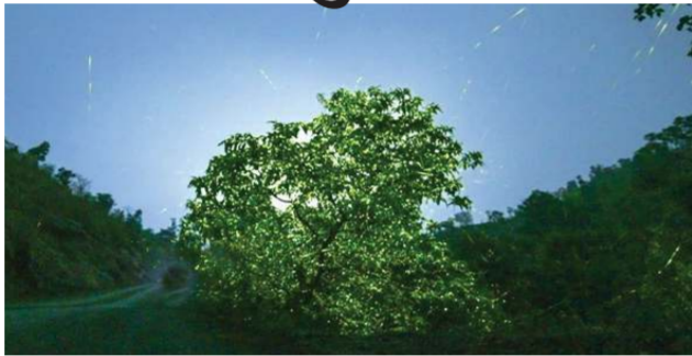
આગિયાઓનો પ્રકાશ એવો છે કે જાણે સૂર્ય ઉગ્યો હોય. જંગલોમાં આગિયા એક નવા જ સૂર્યનું જાણે નિર્માણ કરે છે.

સિંગમાં એક કાલ્પનિક દુનિયા જેવો અદભુત નજારો, લુપ્ત થતા 'ફાયરફ્લાઈઝ'ને નિહાળવા પ્રકૃતિપ્રેમીઓ ઉમટ્યા