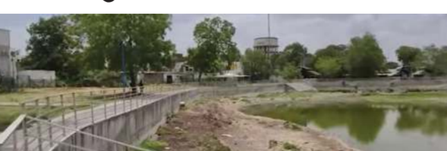
પક્ષના અનેક હોદેદારો તેમજ કાર્યકરો મોટી સંખ્યામાં ઉપસ્થિત રહ્યા હતા. વિપક્ષી નેતાઓએ તળાવ પરિસરની રૂબરૂ મુલાકાત લીધી બાદ સ્થળ પર

(પ્રતિનિધિ) વડોદરા,તા.16 વડોદરા શહેરના ગાજરાવાડી વિસ્તારમાં આવેલા ઐતિહાસિક રામનાથ તળાવના બ્યુટીફિકેશન અને વૃક્ષારોપણની કામગીરીને લઈને મોટો વિવાદ સર્જાયો છે. પાલિકા તંત્ર અને શાસક પક્ષની કામગીરી સામે ગંભીર સવાલો ઉઠાવી આજે વિરોધ પક્ષ દ્વારા તળાવ પરિસર ખાતે ઉચ્ચ વિરોધ પ્રદર્શન કરવામાં આવ્યું હતું. વોર્ડ નંબર-૧૪ માં આવેલા આ તળાવ પર એકંદ્રિત થયેલા સ્થાનિક પ્રતિનિધિઓ, આગેવાનો અને કાર્યકરોએ તંત્રની નીતિઓ સામે ભારે નારાજગી વ્યક્ત કરી સૂત્રોચ્ચાર કર્યા હતા. આ વિરોધ કાર્યક્રમમાં સ્થાનિક વિસ્તારના જનપ્રતિનિધિઓ અને