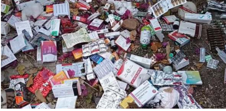
અહીંથી રોજના સેંકડો લોકો અને બાળકો પસાર થાય છે. આ ખુલ્લો મેડિકલ વેસ્ટ ગંભીર રોગચાળો ફેલાવી શકે છે. ચોમાસાની ઋતુ વજીર હોય ત્યારે આવી બેદરકારી સ્થાનિકોના જીવ જોખમમાં મૂકે છે. - સ્થાનિક રહીશ

(પ્રતિનિધિ), વડોદરા. તા.૧૬ ગોત્રીના પોશ ગણતા વિસ્તારમાં આવેલા કલ્પવૃક્ષ કોમ્પ્લેક્સ સામેની ગલીમાં, રોડના કિનારે અત્યંત બેદરકારીપૂર્વક અને ગેરકાયદેસર રીતે બાયો-મેડિકલ વેસ્ટ જાહેરમાં ફેંકી દેવામાં આવતા સ્થાનિક રહીશોમાં ભારે આક્રોશ ફાટી નીકળ્યો છે. પ્રાથમિક તપાસમાં જે વિગતો બહાર આવી છે તે વધુ ચોંકાવનારી છે. જાહેર માર્ગ પર ફેંકી દેવાયેલી દવાઓ અને ઈન્જેક્શનની સામગ્રી એક્સપોઝર થી રૂંટ વગરની હોવાનું