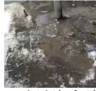
શુદ્ધ પાણી ગંદકીમાં ફેરવાઈ રહ્યું છે. સ્થાનિક નાગરિકો અને સામાજિક કાર્યકરોના જણાવ્યા અનુસાર, સમગ્ર ગાજરાવાડી વિસ્તાર છેલ્લા કેટલાય સમયથી દૂષિત અને ગંદા પાણીની ગંભીર સમસ્યાનો સામનો કરી રહ્યો છે. વડોદરા મહાનગરપાલિકા દ્વારા એક જગ્યાએ લીકેજનું સમારકામ કરવામાં આવે છે ત્યાં બીજી જગ્યાએ ભંગાણ પાણીના આ પાઈપલાઈનો બહુ જૂની

(પ્રતિનિધિ), વડોદરા. તા.૧૬ વડોદરામાં સ્માર્ટ સિટીના મોટા-મોટા ઘાવાઓ વચ્ચે તંત્રની ગંભીર બેદરકારી જોવા મળી રહી છે, જેના કારણે સ્થાનિક જનતા ભારે હાલાકી ભોગવવાની સામનો કરી રહી છે. શહેરમાં પીવાના શુદ્ધ પાણીનો બેફામ વેડફાટ થવાની ઘટનાઓ અટકવાનું નામ નથી લઈ રહી. સોમવારે કોટી ચાર રસ્તા પાસે પાણીની લાઈનના વાલ્વમાં ભંગાણ સર્જના બાદ, મંગળવારે વહેલી સવારથી ગાજરાવાડી સ્મશાન રોડ પર પાણીની મુખ્ય લાઈનમાં મોટું લીકેજ જોવા મળ્યું હતું. બિહાર ટોકીઝથી ગાજરાવાડી તરફ જતા મુખ્ય માર્ગ પર સવારે સાડા સાત વાગ્યાથી હજારો લિટર ચોખ્ખું પાણી રસ્તા પર વહીને સીધું ગટરમાં ભેગું થઈ રહ્યું છે. એક તરફ ઉનાળાની સિંચાઈમાં વડોદરાના અંતક વિસ્તારોમાં રહીશોને પૂરતા પ્રેશરથી પાણી મળતું નથી, ત્યારે પાલિકાના સત્તાધીશોની બેદરકારીને કારણે કિમતી