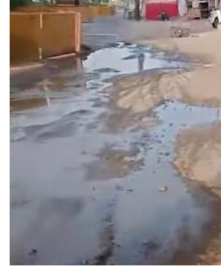
રસ્તાની કામગીરી ચાલી રહી છે. રોડ રસ્તાના આ ખોડકામ અને અધૂરી કામગીરીના લીધે વાહનચાલકો અને રહીશો ઓલરેડી ભારે મુશ્કેલીનો સામનો કરી જ રહ્યા હતા. તેવામાં જ્યાં રસ્તાનું કામ ચાલી રહ્યું છે તેનાથી

(પ્રતિનિધિ), વડોદરા. તા.૧૬ વડોદરા મહાનગરપાલિકાના કહેવાતા સ્માર્ટ તંત્રની વધુ એક ઘોર બેદરકારી સામે આવી છે, જેના કારણે સ્થાનિક જનતા ભારે હાલાકીનો સામનો કરી રહી છે. શહેરના ખોડિયારનગર વિસ્તારમાં આવેલા ઉપવન હેરિટેજ પાસે રોડની વચ્ચેથી અચાનક પાણીના ફુવારા ઉડતા જોવા મળ્યા હતા. જમીનની અંદરથી પસાર થતી મુખ્ય પાણીની લાઈનમાં મોટું લીકેજ સર્જવાના કારણે હજારો લિટર પીવાનું ચોખ્ખું પાણી રસ્તા પર ફરી વળ્યું હતું. આ કિમતી પાણીનો મોટો જથ્થો વેડફાઈને સીધો ગટરમાં વહી રહ્યો છે, જેને લઈને સ્થાનિક લોકોમાં તંત્ર સામે ભારે રોષ જોવા મળી રહ્યો છે. તેવામાં આ વિસ્તારમાં છેલ્લા ઘણા સમયથી