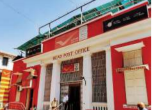
રજિસ્ટર્ડ પોસ્ટ, પાર્સલ તથા અન્ય ટપાલ સેવાઓના બુકિંગ માટે મેઈલ બુકિંગ કાઉન્ટરની સુવિધાનો સરળતાથી લાભ લઈ શકશે. ખાસ કરીને સાંજના સમયે ઓફિસેથી છૂટ્યા બાદ પણ નાગરિકો ટપાલ સંબંધિત કામગીરી કરાવી શકશે. ભારતીય ટપાલ વિભાગે તમામ ગ્રાહકોને આ વિસ્તૃત સેવા સુવિધાનો મહત્તમ ઉપયોગ કરવા અનુરોધ કર્યો છે. વિભાગનું માનવું છે કે સમય વધારવાથી રાવપુરા હેડ પોસ્ટ ઓફિસ પર ભીડ ઘટશે અને ગ્રાહકોને ઝડપી સેવા મળી રહેશે.

(પ્રતિનિધિ) વડોદરા,તા.16 ભારતીય ટપાલ વિભાગ, વડોદરા પૂર્વ વિભાગ દ્વારા ગ્રાહક સુવિધાને ધ્યાને રાખીને મહત્વનો નિર્ણય લેવામાં આવ્યો છે. રાવપુરા સ્થિત વડોદરા હેડ પોસ્ટ ઓફિસ 3900001 ખાતે મેઈલ બુકિંગ કાઉન્ટરનો કાર્ય સમયગાળો લંબાવીને હવે સવારે 08:00 થી રાત્રે 20:00 વાગ્યા સુધી કરી દેવામાં આવ્યો છે. ગ્રાહકોને વધુ સુવિધા પૂરી પાડવાના હેતુથી આ સુધારો કરવામાં આવ્યો છે. હવે દર સોમવારથી શનિવાર સુધીના તમામ કાર્યકારી દિવસોમાં મેઈલ બુકિંગ કાઉન્ટર સતત 12 કલાક સુધી કાર્યરત રહેશે. અગાઉ મર્યાદિત સમયમાં સેવા મળતી હોવાથી નોકરિયાત વર્ગ અને વેપારીઓને મુશ્કેલી પડતી હતી, જે હવે દૂર થશે. આ વિસ્તૃત કાર્ય સમય દરમિયાન જાહેર જનતા સ્પીડ પોસ્ટ,