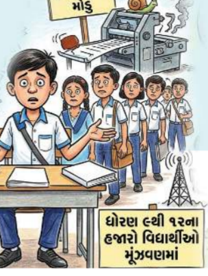
ધોરણ ૯થી ૧૨ના હજારો વિદ્યાર્થીઓ મૂંઝવણમાં

પુસ્તકો સમયસર મળી શકશે નહીં અને જૂન મહિનાના અંત સુધીમાં પુસ્તકો ઉપલબ્ધ થવાની શક્યતા છે. શિક્ષણ વિભાગ દ્વારા તમામ પાઠ્યપુસ્તકો ઓનલાઈન ઉપલબ્ધ હોવાનું જણાવવામાં આવ્યું છે અને ડિજિટલ માધ્યમોનો ઉપયોગ કરીને શિક્ષણકાર્ય શરૂ રાખવા સૂચના આપવામાં આવી છે. જોકે ગ્રામ્ય વિસ્તારોમાં હજુ પણ ઘણા વિદ્યાર્થીઓ પાસે સ્માર્ટફોન, ઈન્ટરનેટ અથવા ડિજિટલ સાધનોની પૂરતી સુવિધા ઉપલબ્ધ નથી. તેથી માત્ર ઓનલાઈન પુસ્તકોના આધાર પર અભ્યાસ ચલાવવો દરેક વિદ્યાર્થી માટે શક્ય નથી.