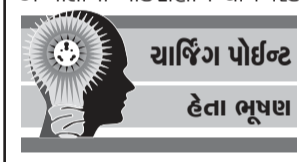
ચાર્જિંગ પોઈન્ટ હેતા ભૂષણ

એક યુવાન અને તેની પત્ની નવું ઘર લેવા માટે ફ્લેટ ખેતા હતા. ઘણા ફ્લેટ ખેતા પણ કંઈ સરસ મળતું ન હતું. એક સરસ ટેસ્ટ ફ્લેટની છાપમાં બહેરાત વાંચી, બહેરાતમાં વર્ણન વાંચી લાગ્યું કે તેઓને આતું જ ઘર બોઈએ છે. તેઓ ફ્લેટ ખેતા તે જ દિવસે પહોંચી ગયા. ફ્લેટમાં એક લગભગ ૮૦ કે ૮૨ વર્ષના બા હતાં અને તેમની એક નોકરાણી, બીજું કોઈ હતું નહિ. યુવાને કહ્યું, “અમે છાપાની બહેરાત વાંચી ફ્લેટ ખેતા આવ્યા છીએ. પણ બે કોઈ ઘરમાં ન હોય તો પછી આવીશું.” ત્યાં બા બોલ્યાં, “અંદે આવો આવો, અહીં સુધી આવ્યા છો તો ફ્લેટ તો બોઈ લો.” યુવાન અને તેની પત્ની ચાલો સાવ ઘડકો ન થયો એમ વિચારી ફ્લેટમાં અંદર ગયા. ફ્લેટ બહુ જ સરસ, સાફ, સુઘડ હતો. ટેસ્ટ ગાર્ડન અને ઝૂલો પણ મનમોહક હતાં. યુવાન અને તેની પત્નીને ફ્લેટ ઘણો ગમી ગયો પણ મનમાં મૂંઝાતા હતાં કે હવે ફ્લેટ માટે આ બા સાથે શું વાત કરીએ? યુવાને દીમીથી કહ્યું, “બા, ફ્લેટ માટે કોની સાથે વાત કરવાની છે તે કહો અને ફોન નંબર આપો.” બા હસતાં હસતાં બોલ્યાં, “અંદે બેટા, બેસ તો ખરો, ફ્લેટ માટે વાતો થતી રહેશે. પહેલાં યા નાસ્તો તો કરો.” આટલું કહીને બા એ પોતાની નોકરાણીને યા બિસ્કીટ, બટાટાપોંચા ગયેને લાવવાનો