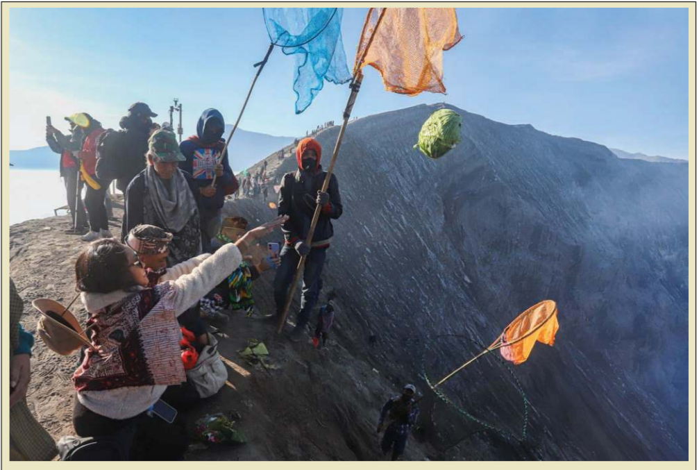
પૂર્વ જાવામાં યજ્ઞ કસાડા વિધિ દરમિયાન તેંગેરી લોકો હોમો પર્વત પર શાકભાજીનો પ્રસાદ ચડાવે છે. યજ્ઞ કસાડા ઉત્સવ દિવસ દરમિયાન પાસેથી સલામતી અને સમૃદ્ધિ માટે આશીર્વાદ મેળવવા માટે ઉજવવામાં આવે છે, જેમાં ચોખા, ફળો, પશુધન અને અન્ય વસ્તુઓનો પ્રસાદ ચઢાવવામાં આવે છે.

બ્રિટિશ કંપની સ્કાયકટરનો સમાવેશ થાય છે. પરીક્ષણ કરાયેલા ડ્રોન પ્રમાણમાં સસ્તા છે, દરેક ડ્રોનની કિંમત લગભગ $૬,૦૦૦ છે, અને તે યુદ્ધમાં ખર્ચ કરી શકાય તે રીતે ડિઝાઇન કરવામાં આવ્યા છે. ડ્રોન રેસિંગમાં વપરાતી ટેકનોલોજીથી પ્રેરિત થઈને, તેઓ ઉચ્ચ ગતિએ ધાવપેચ કરી શકે છે અને નોંધપાત્ર ચોકસાઈ સાથે લક્ષ્યોને ટ્રાક કરશે. વિજેતાઓને પસંદ કરવા માટે, પેન્ટાગોને પડકારોની શ્રેણી બનાવી જેમાં લશ્કરી કર્મચારીઓએ લાંબા અંતરના હુમલાઓથી લઈને માળખાંની અંદરના હુમલાઓ સુધીના મિશન પર ડ્રોનનું પરીક્ષણ કર્યું.