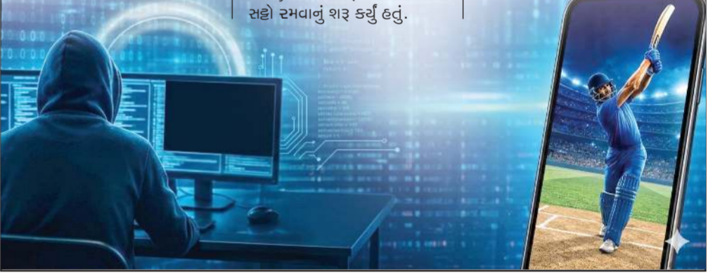
...અનુસંધાન પાના 7 પર

મહિંદાપુરાના આંગડિયા મારફતે પૈસાની લેવડ દેવડ થતી તેને બંને આઈડી. અને પાસવર્ડના બદલામાં રૂ. ૧૦-૧૦ હબરની કેડિટ આપવામાં આવી હતી. પ્રથમ આઈડી: 'khalifa365.com' વેબસાઇટ પર 'AKL101' નામનું આઈડી. હતું, જેમાં રૂ. ૮,૪૧૦.૬૮નું બેલેન્સ હતું. દ્વિતીય આઈડી: 'www.betflash.com' વેબસાઇટ પર '3371KS' નામનું આઈડી. હતું, જેમાં રૂ. ૭,૦૩૪.૪૩નું બેલેન્સ હતું. સહ્યામાં ...અનુસંધાન પાના 7 પર