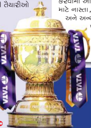
...અનુસંધાન પાના 7 પર

શહેરના કલબ હાઉસ, સ્ટેડિયમ, કાફે, મોલ્સ તેમજ વિવિધ રહેણાંક સોસાયટીઓ અને શેરી-મોહલ્લાઓમાં એકસાથે મેચ નિહાળવા માટે વિશેષ આયોજન કરવામાં આવ્યું છે.