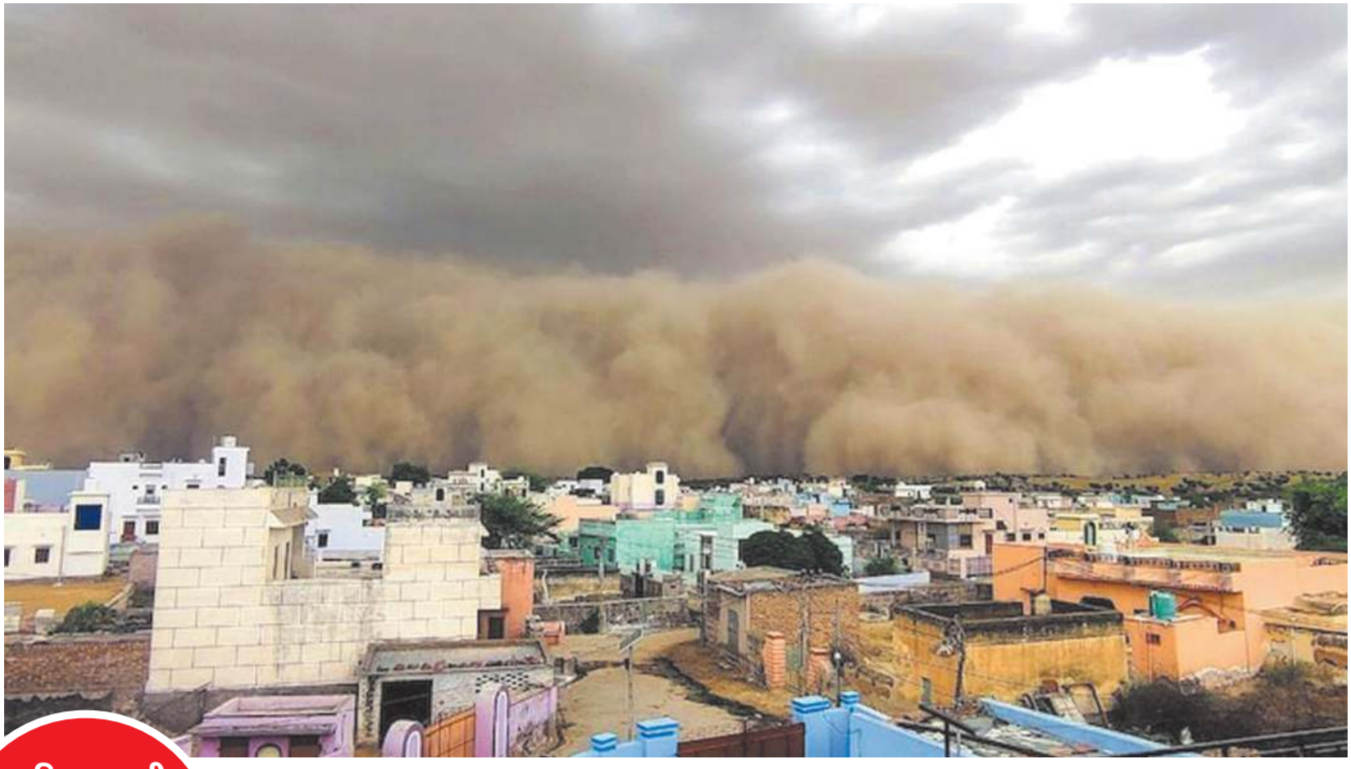
પાકિસ્તાનથી ઉદભવેલા આ તોફાનની સરહદી જિલ્લાઓ પર અસર

ધૂળ અને રેતીની ડમરીઓથી રાજસ્થાનના અનેક શહેરોમાં દ્રશ્ય ક્ષમતા ઘણી ઓછી થઈ ગઈ છે. રાજધાની દિલ્હીમાં પણ ધૂળના તોફાન પછી વરસાદ, ઉત્તર ભારતના અનેક ભાગોમાં વરસાદથી રાહત પંજાબ, હરિયાણા, યુપીના અનેક ભાગોમાં વરસાદ, હિમાચલમાં વરસાદની સાથે કરા પડ્યા