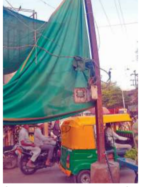
બેદરકારી દાખવવામાં આવી છે. કપડવંજના મીના બજારમાં લગાવવામાં આવેલા આ લીલા પડદા સીધા જ વીજળીના થાંભલા (વીજપોલ) અને જીવંત વીજ કેબલ સાથે બાંધવામાં આવ્યા છે. પવન ફૂંકાય ત્યારે

(પ્રતિનિધિ) કપડવંજ તા.૩૦ કપડવંજ શહેરના અત્યંત વ્યસ્ત ગણાતા મીના બજાર વિસ્તારમાં અત્યારે ગરમીથી રાહત મેળવવા માટે કરવામાં આવેલી એક કામચલાઉ વ્યવસ્થા સ્થાનિકો અને ગ્રાહકો માટે જીવંત જોખમ બની ગઈ છે. બજારના કેટલાક દુકાનદારોએ આકરા તાપથી બચવા માટે પોતાની દુકાનોની બહાર લીલી નેટના પડદા લગાવ્યા છે, પરંતુ આ પડદા લગાવવામાં ગંભીર