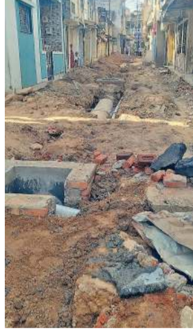
કામગીરી માટે જૂનો રોડ તોડી નાખ્યા બાદ એજન્સીએ ૧૨ દિવસ સુધી કોઈ જ નિર્ણય લીધો ન હતો, જેના કારણે સ્થાનિકોમાં ઉગ્ર આક્રોશ ફાટી નીકળ્યો હતો.

સુધીમાં ૧૫થી વધુ ઝડા-ઉલટીના કેસો નોંધાયા છે. ખેડા શહેરમાં નવીન ગટર લાઈન નાખવા માટે જેસીબી મશીન વડે તોડફોડ કરવામાં આવતા પીવાના પાણીની પાઈપલાઈનમાં ભારે નુકસાન થયું છે. જેના કારણે છેલ્લા ૧૫ દિવસથી આ વિસ્તારમાં પીવાના પાણીની વિકટ સમસ્યા સર્જાઈ છે. આટલું ઓછું હોય તેમ, વિસ્તારની મોટર પણ બગડી જતા રહીશો પાણીના એક-એક ટીપા માટે તરસી રહ્યા છે. પાલિકા દ્વારા રિપેરિંગની કામગીરી તો કરવામાં આવી છે, પરંતુ હજુ પણ અનેક ઘરોમાં દૂષિત પાણીની સમસ્યા યથાવત છે. પાલિકા દ્વારા ગટરની